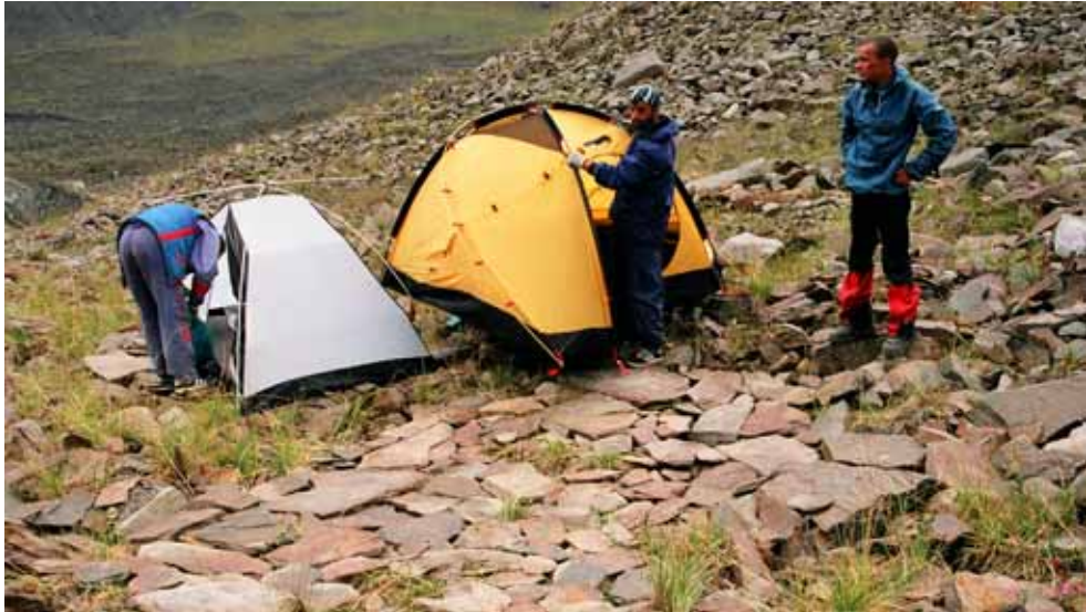
Фото № 134. Обустройство ночёвок близ устья ледника Преображенского.