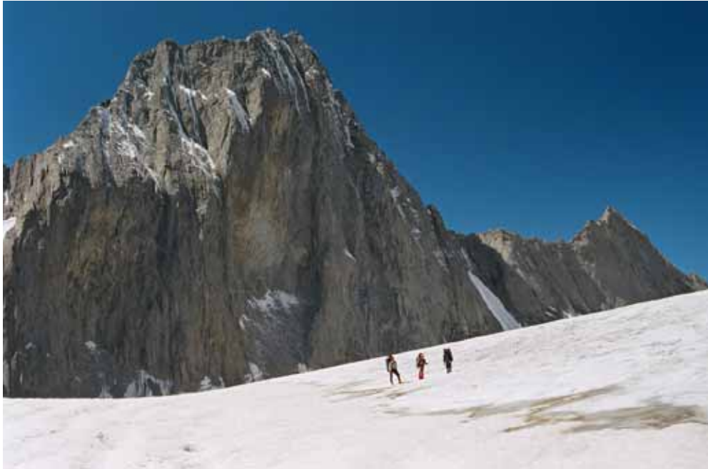
Фото № 143. Подъём в юго-западную камеру ледника Преображенского.