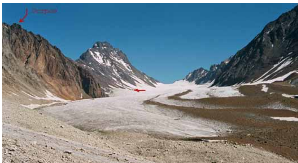
Фото № 142. Основная (северная) ветвь ледника Преображенского. Стрелкой показан возможный путь к перевалу Аксу-Рама и Джаупая.