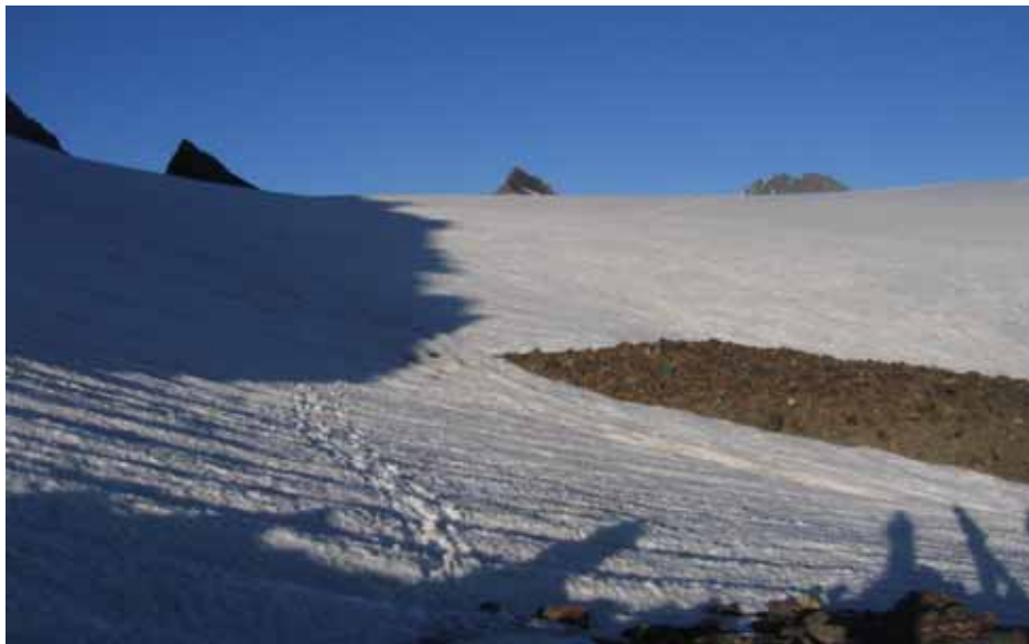
Фото № 156. Вид с перевала Аксу-Рама на водораздельный хребет.