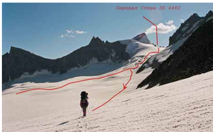
Фото № 151. Траверс юго-западной камеры от цирка перевала Стена.