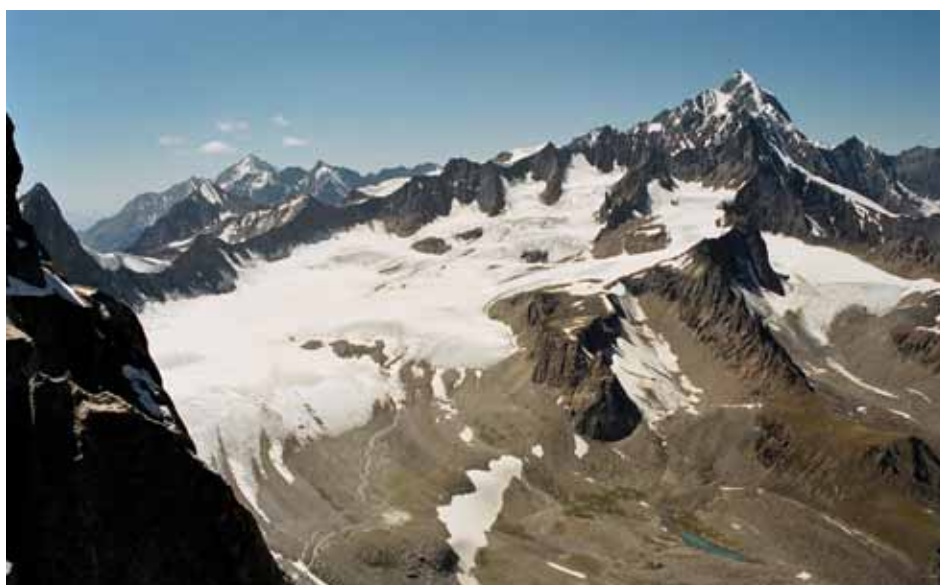
Фото № 148. Вид на Туркестанский хребет и пик Пирамидальный с перевала Стена.