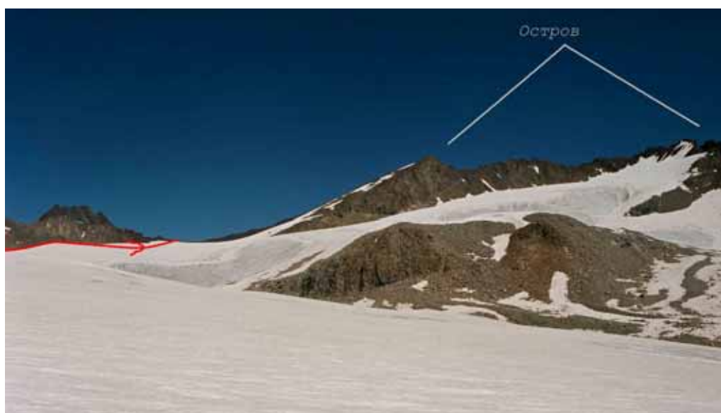
Фото № 145. Местоположение перемётного ледника, ведущего к перевалам Аксу-Рама и Джаупая.