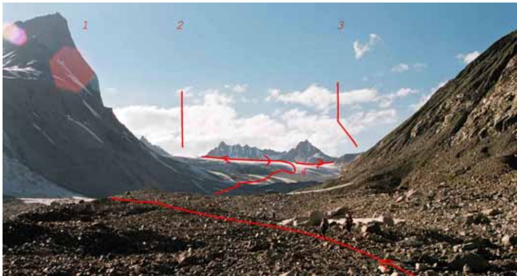
Фото № 138. Средняя часть ледника Преображенского: 1 – пик Горняк; 2 – к перевалу Стена; 3 – к перевалу Аксу-Рама; 4 – ступень ледника, ведущая в юго-западную камеру.