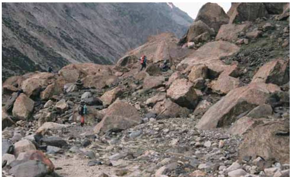
Фото № 162. Каменный завал недалеко от языка ледника Аксу.