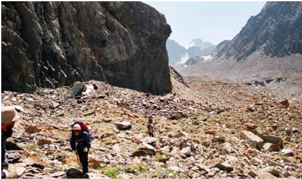
Фото № 161. Характер пути у Чёрной скалы в ущелье Аксу.