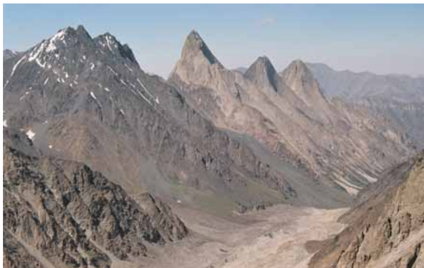
Фото № 149. Вид с перевала Стена на ущелье Аксу: 1 – пик 4810; 2 – пик 1000-летия Крещения Руси; 3 – пик Слёсова; 4 – ледник Аксу;