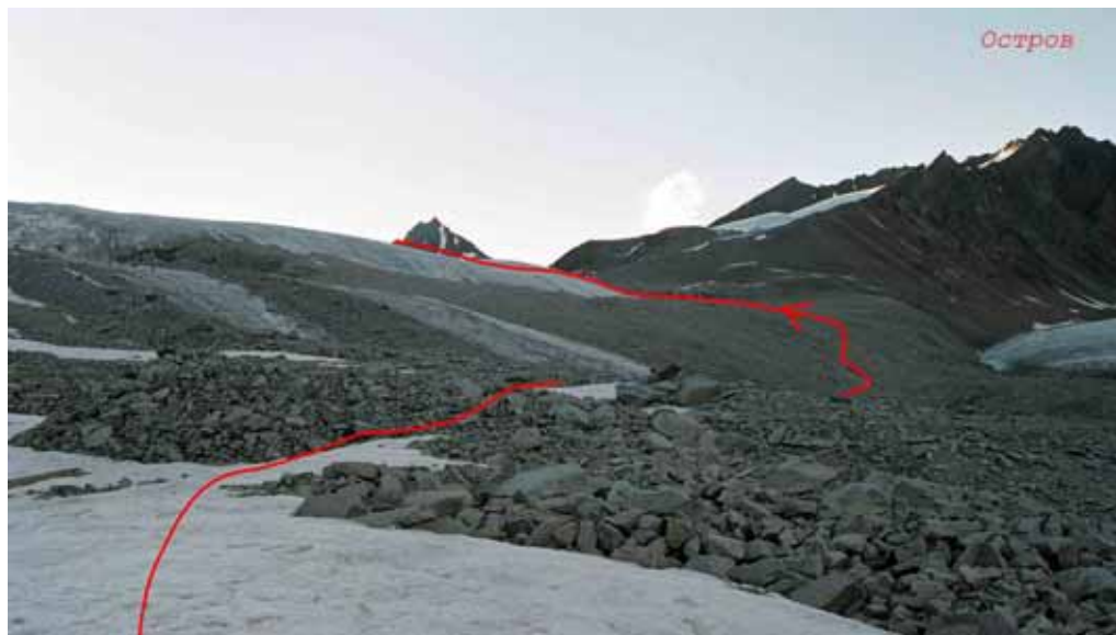
Фото № 140. Ступень ледника, ведущая в юго-западную камеру (к перевалу Стена).