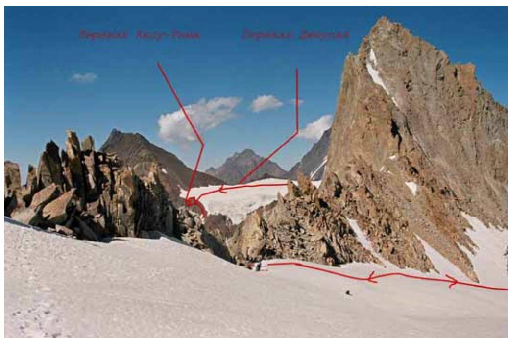
Фото № 150. На перевале Стена (3А-3Б,4460). Виден перевал Джаупа.