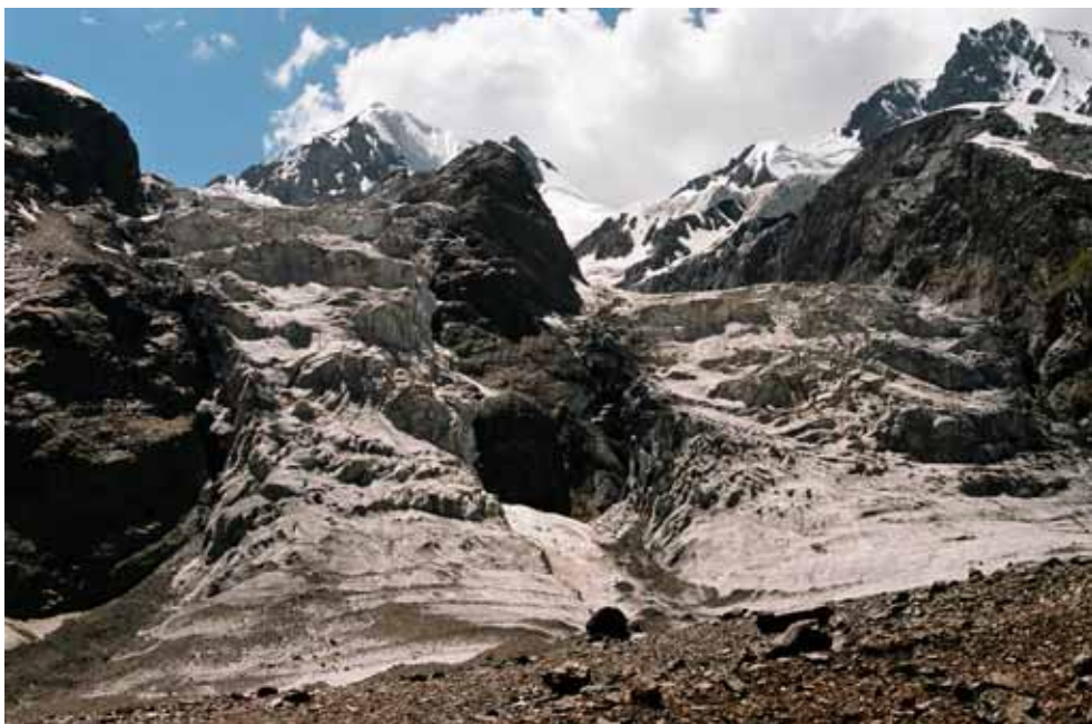
Фото № 136. Ледопады над правым бортом ледника Преображенского.