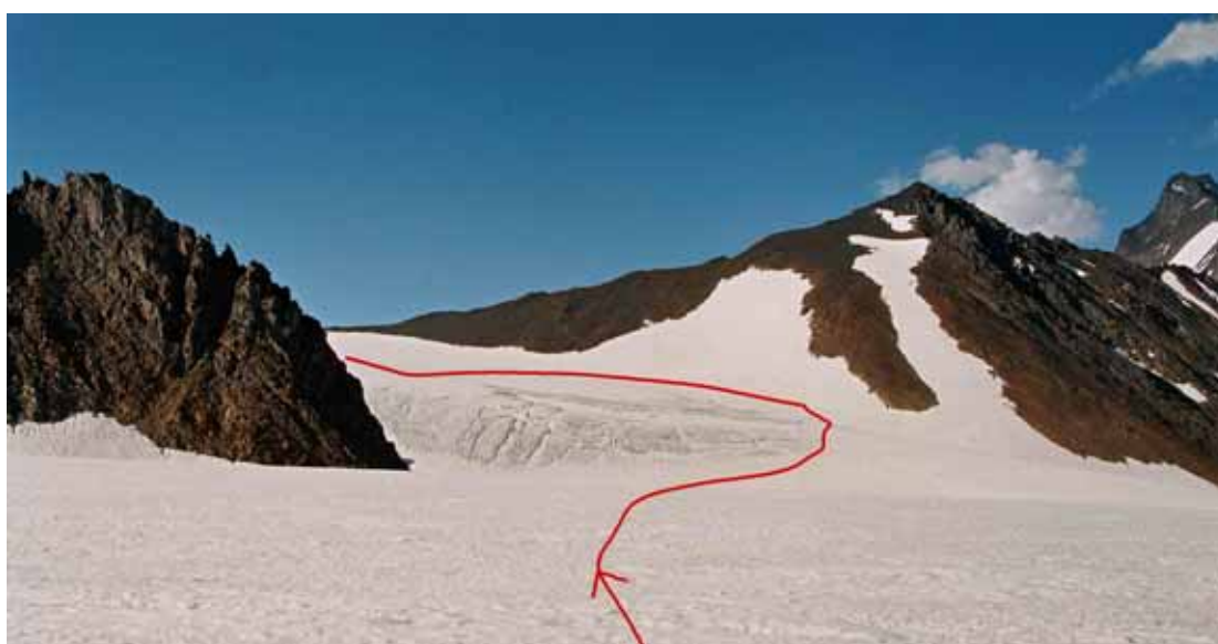
Фото № 153. Вид с Купола на вход в цирк перевалов Аксу-Рама и Джаупая.