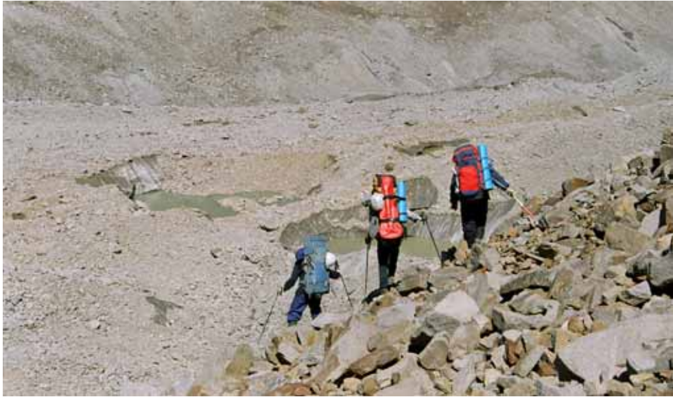
Фото № 160. Спуск из цирка перевала Аксу-Рама на ледник Аксу.