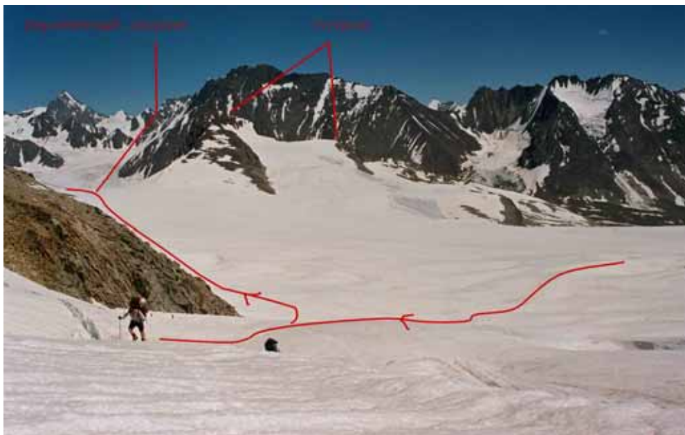
Фото № 146. Подъём к седловине перевала Стена. Виден перемётный ледник и Остров.