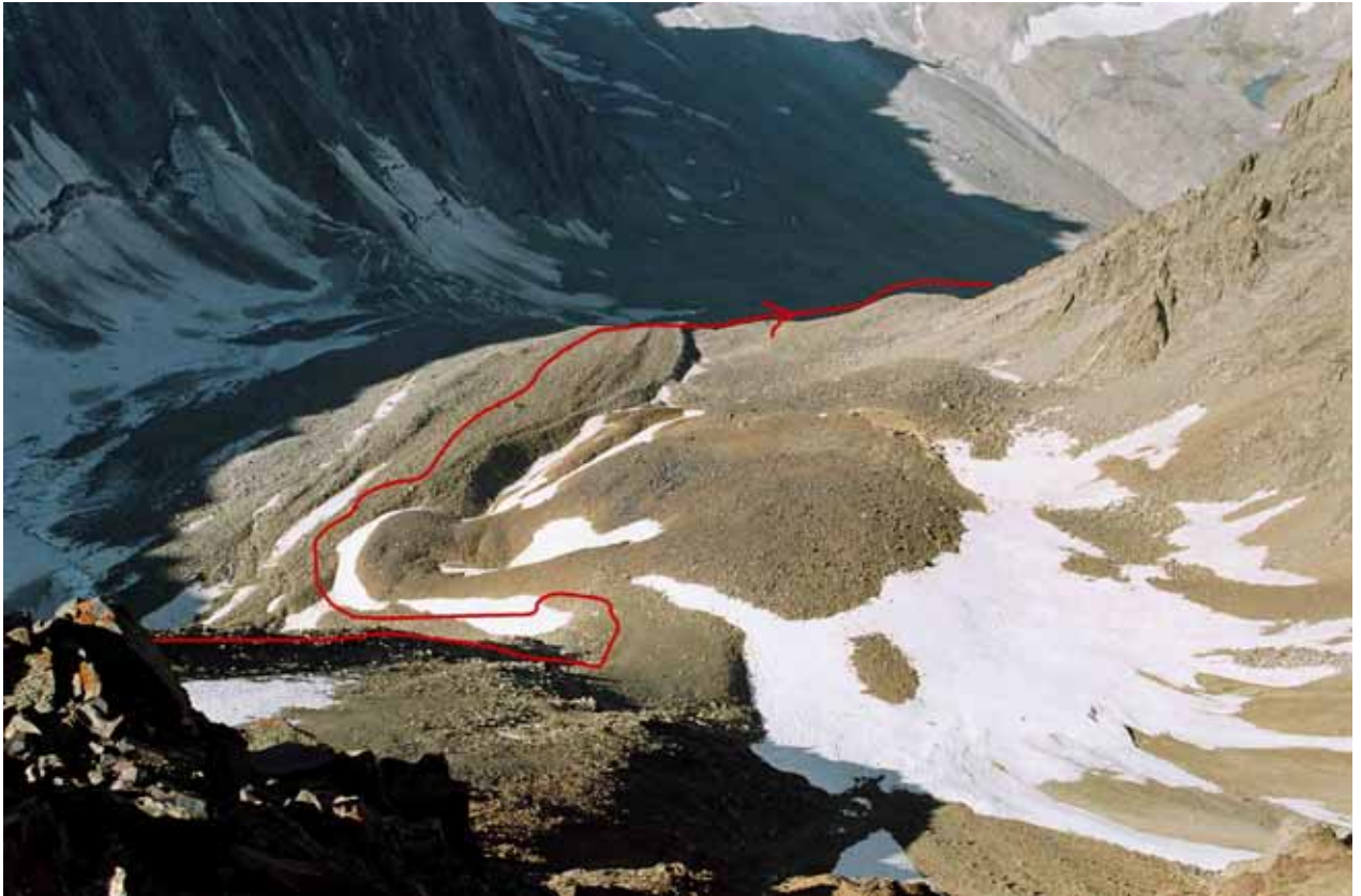
Фото № 158. Вид с перевала Аксу-Рама на путь спуска.