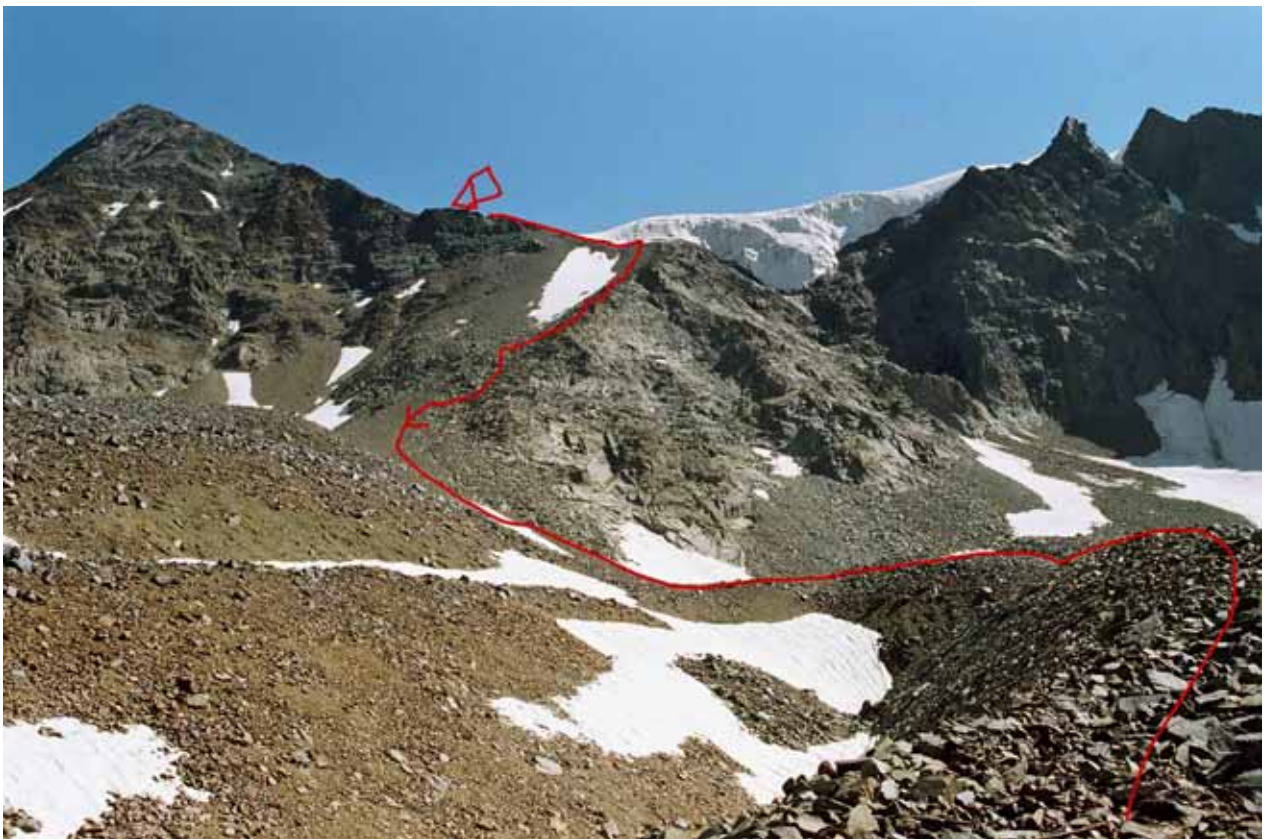
Фото № 159. Перевал Аксу-Рама (1Б,4440) с запада.