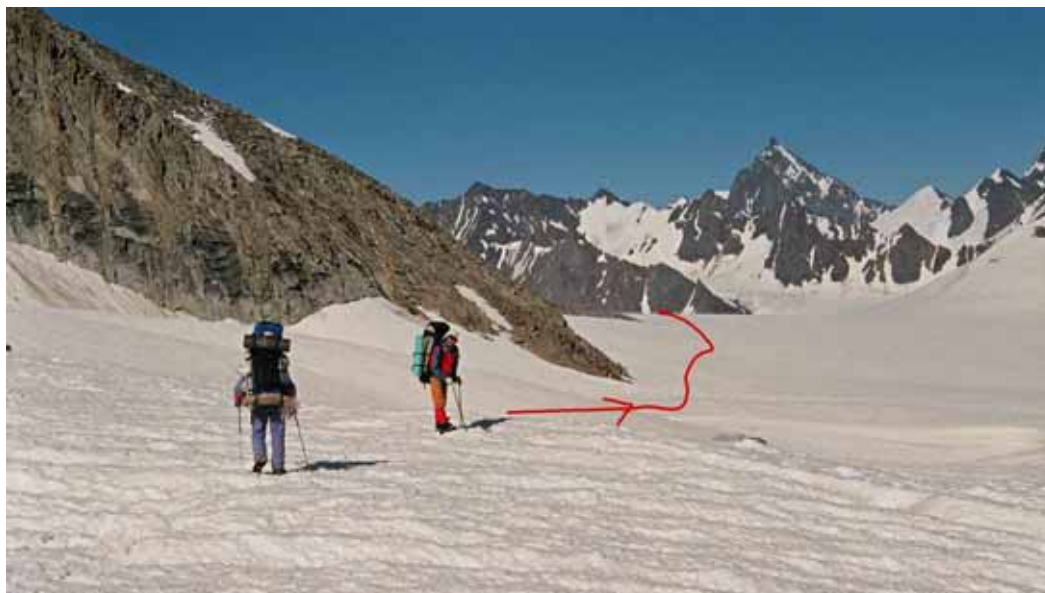
Фото № 152. Траверс юго-западной камеры к перемётному леднику.