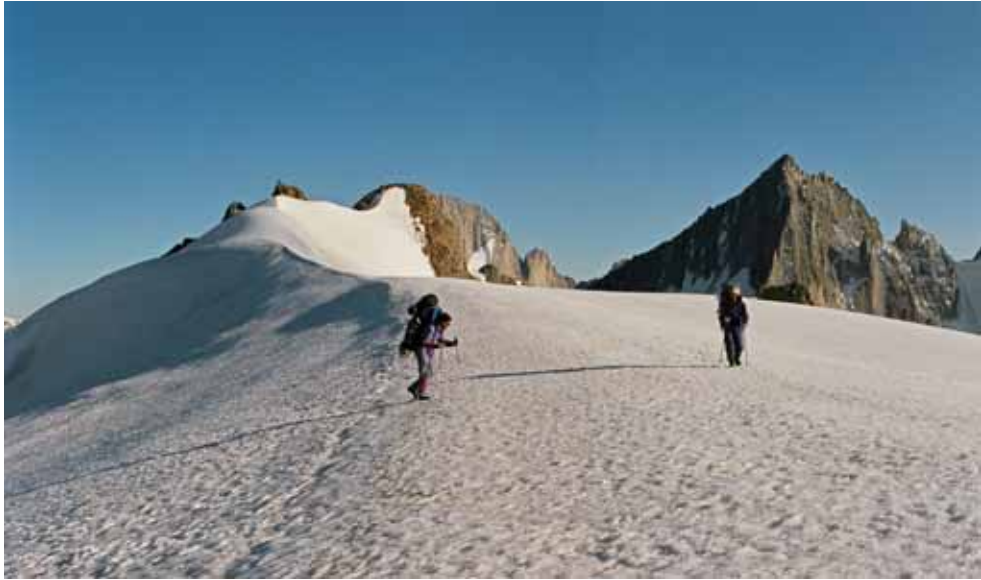
Фото № 155. Водораздельный хребет между северо-западным цирком ледника Преображенского и ледником Аксу.