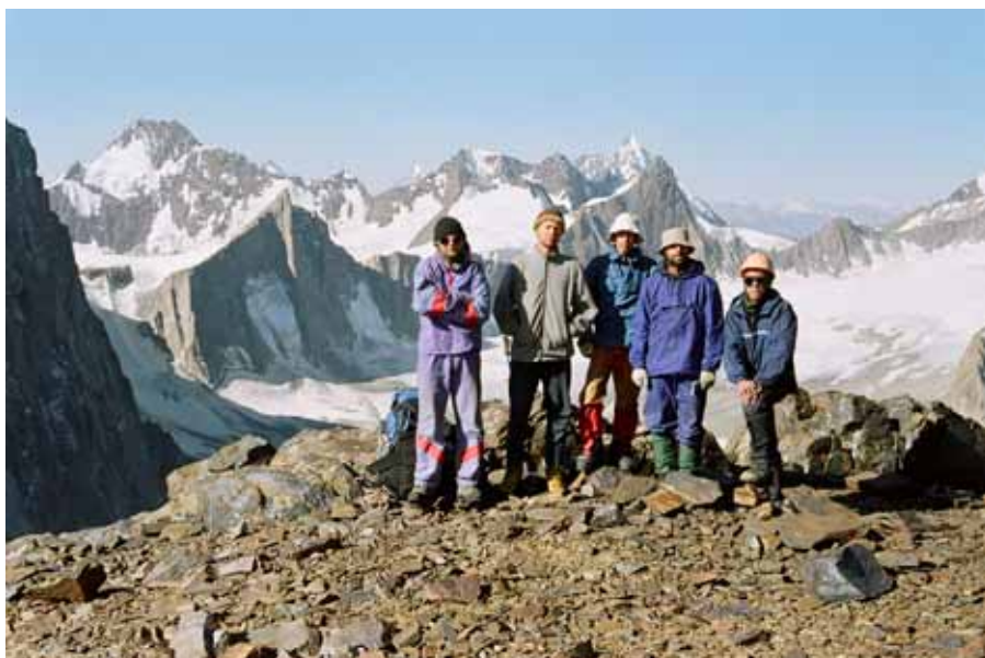
Фото № 157. Группа на перевале Аксу-Рама (1Б,4440).