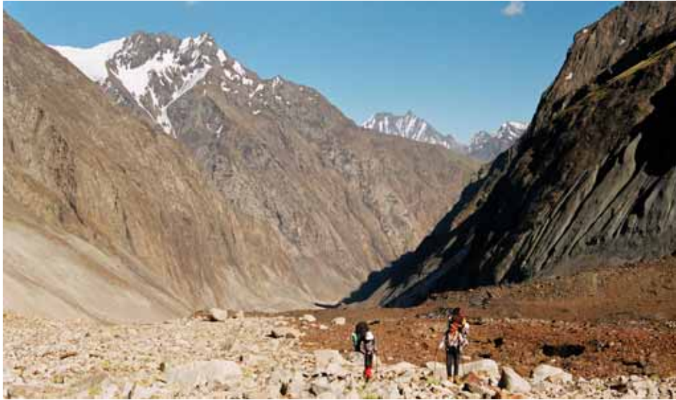
Фото № 137. Характер пути по осыпным участкам левого борта ледника Преображенского.