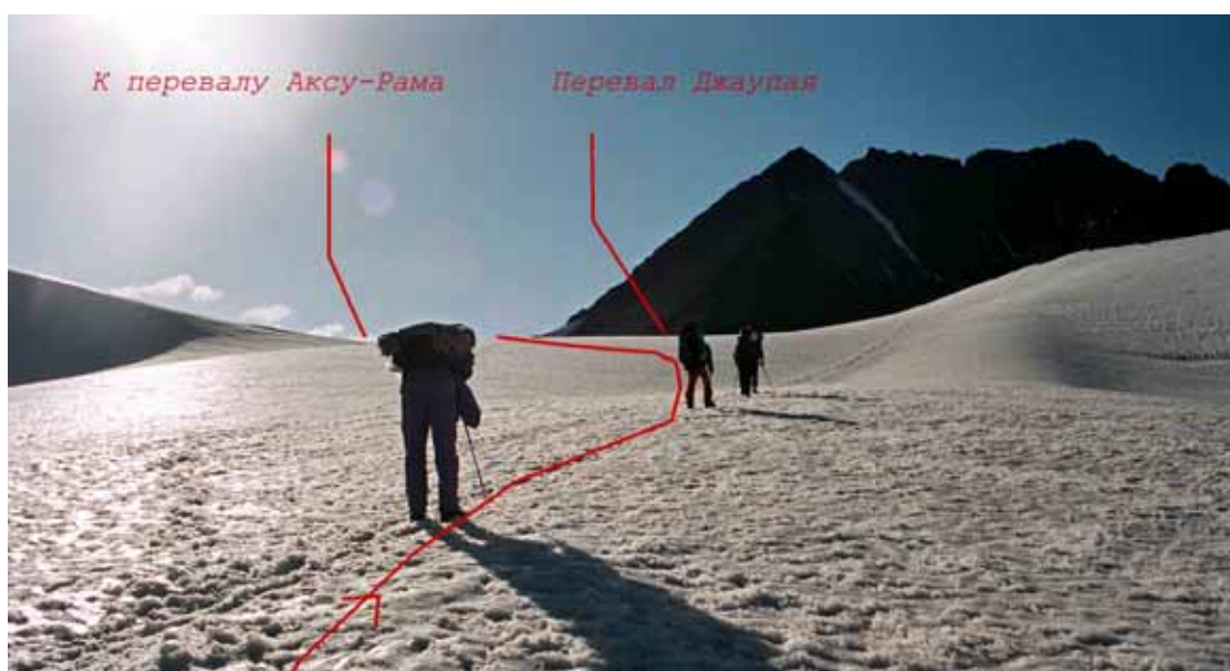
Фото № 154. Подъём на водораздельный хребет перевалов Аксу-Рама и Джаупая.