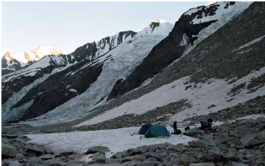
Фото № 139. Ночёвка на снежнике среди осыпных островов ледника Преображенского.