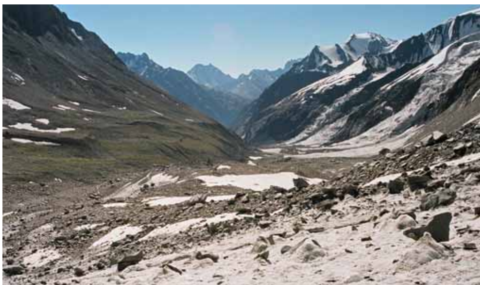
Фото № 141. Характер склонов у левого борга средней части ледника Преображенского.