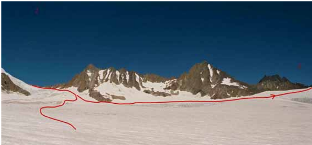
Фото № 144. Перевал Стена (1) из юго-западной камеры ледника Преображенского. 2 – к перевалу Аксу-Рама и Джаупая.