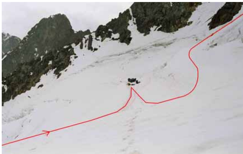
Фото № 106. Место ночёвки под основанием ледового горба.