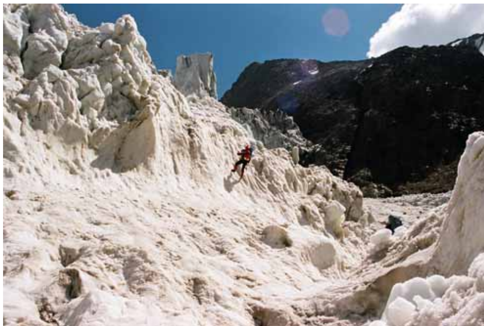
Фото № 128. Спуск по ледопаду Рама