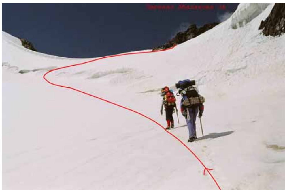
Фото № 109. Подход под бергшунд перевала Абалакова.