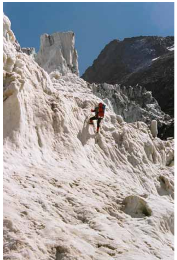
Фото № 126, 127. Спуск по ледопаду Рама.