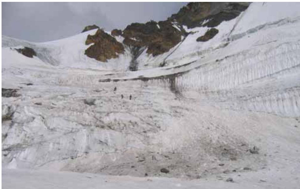
Фото № 115. Четвёртая верёвка при спуске с предперевального плато.