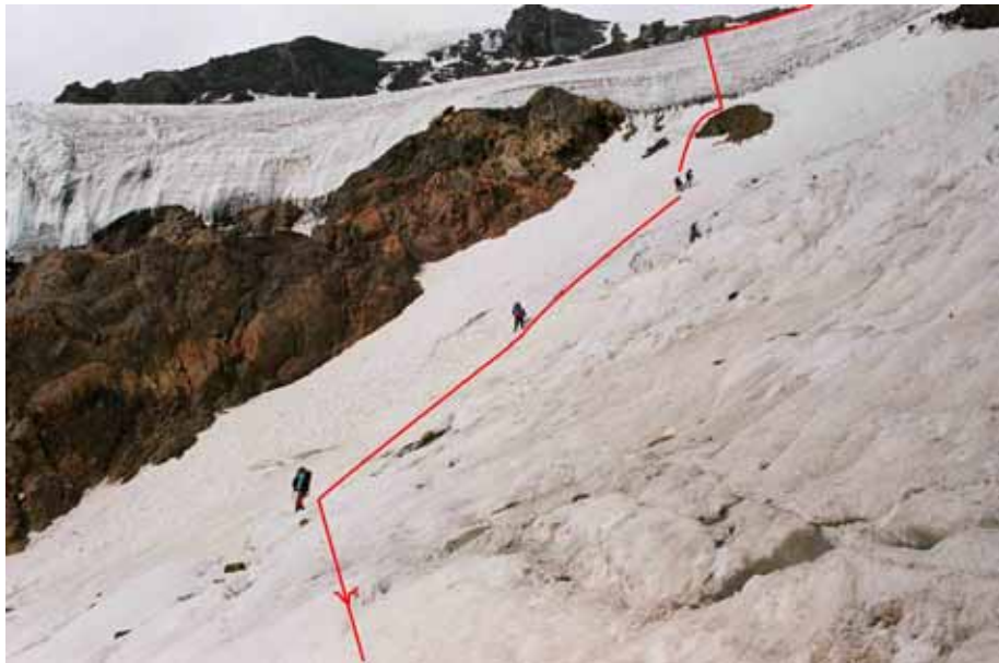
Фото № 114. Спуск с предперевального плато.