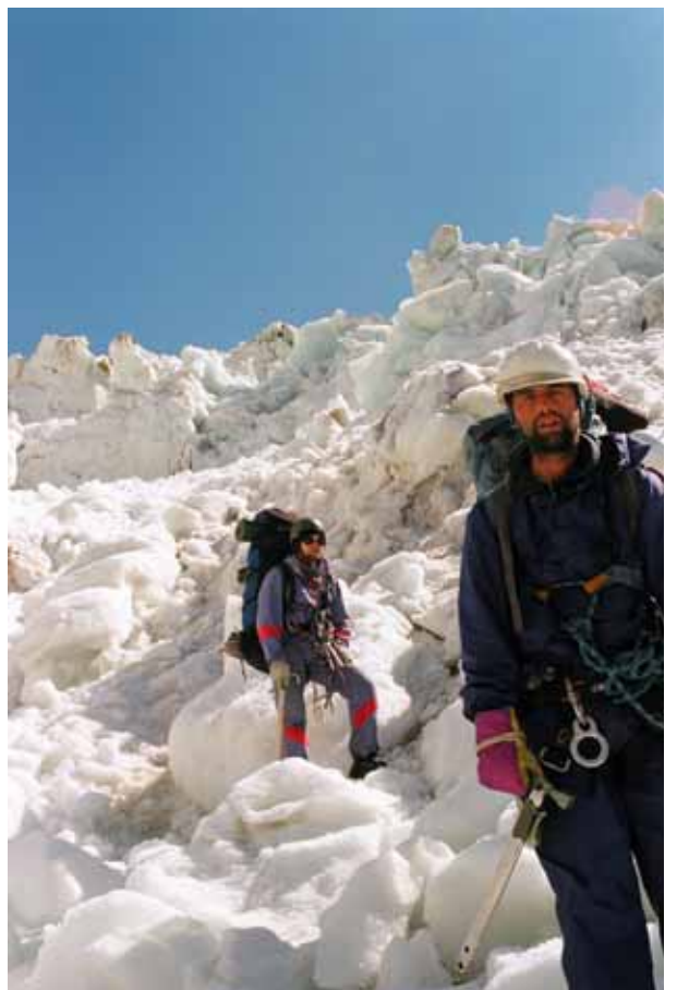
Фото № 123. Спуск последнего через ледовый гребень. Фото № 124. Зона обвала справа от ледового гребня.