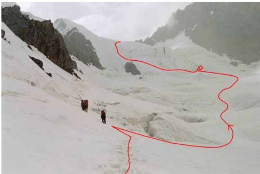
Фото № 105. Выход на разорванное плато выше верхнего ледопада.