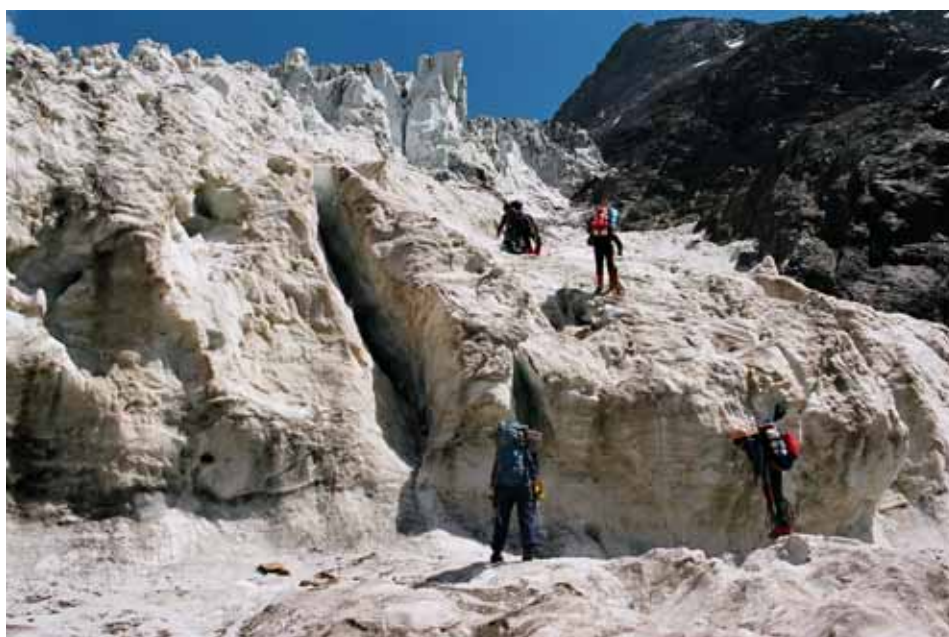
Фото № 130. Спуск по ледопаду Рама.