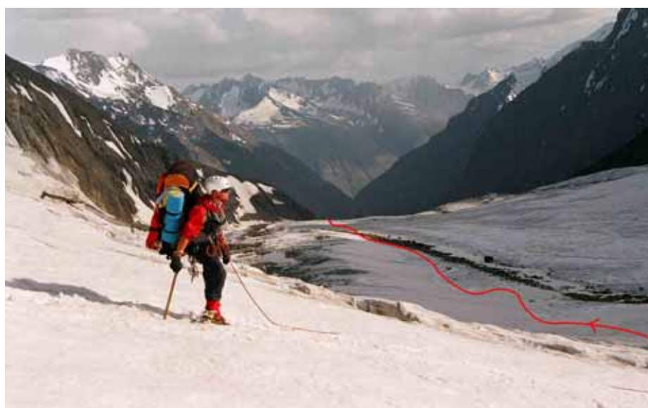
Фото № 118. Ледник Рама после спуска из цирка перевала Абалакова.