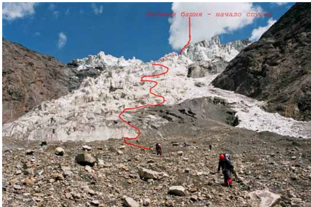
Фото № 131. Подвижные осыпи под основанием нижнего ледопада Рама.