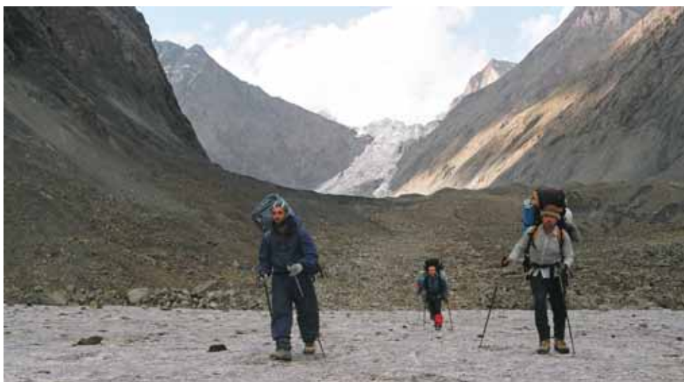
Фото № 132. Характер пути по нижней части ледника Рама.