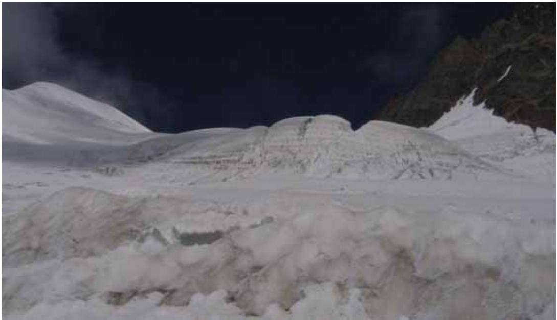
Фото № 107. Ледовый горб, закрывающий седловину перевала Абалакова.