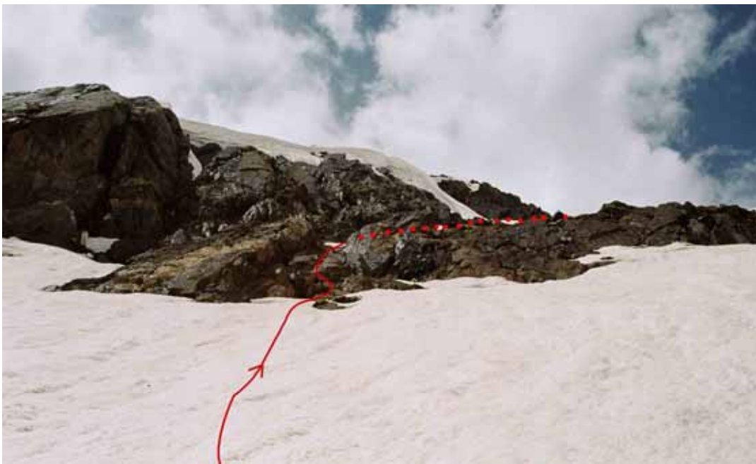
Фото № 102. Скальный пояс, венчающий снежно-ледовый склон.