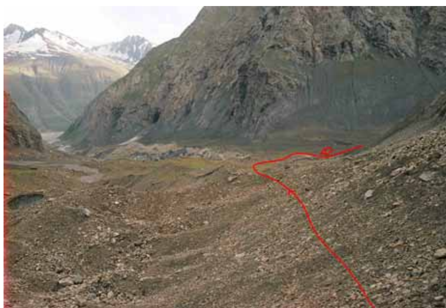
Фото № 133. Устье ледника Преображенского с правобережной морены ледника Рама.