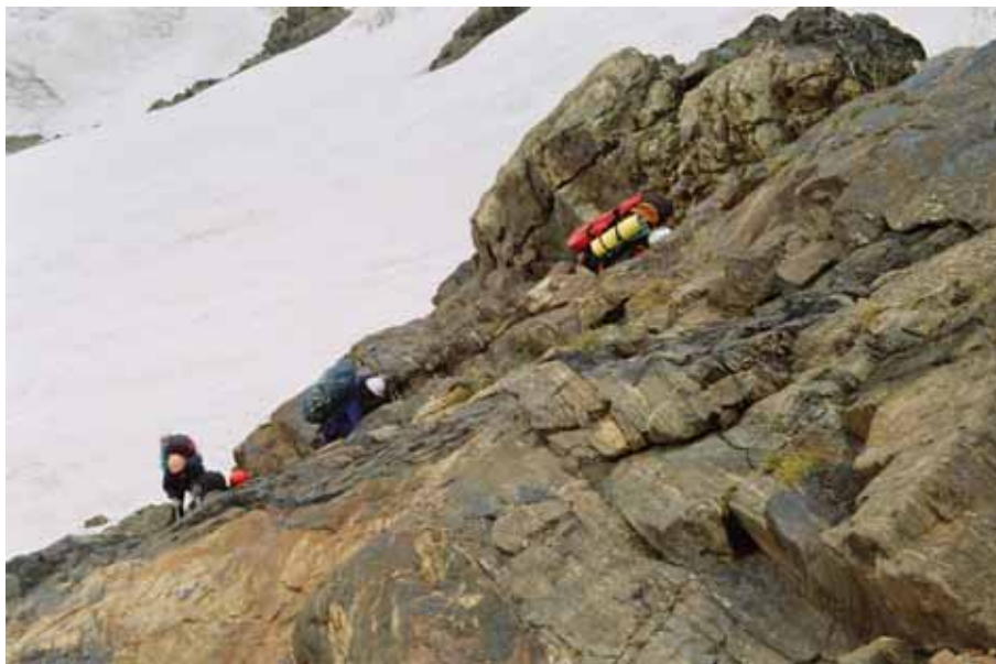
Фото № 103. Характер скал при подъёме на скальный пояс.