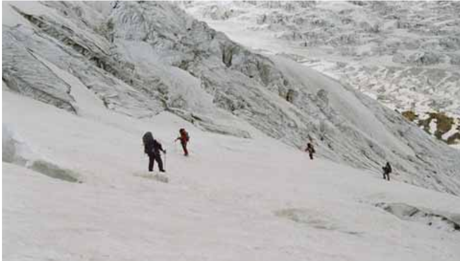
Фото № 101. Подъём по снежно-ледовому склону между нижним ледопадом и скальным гребнем.