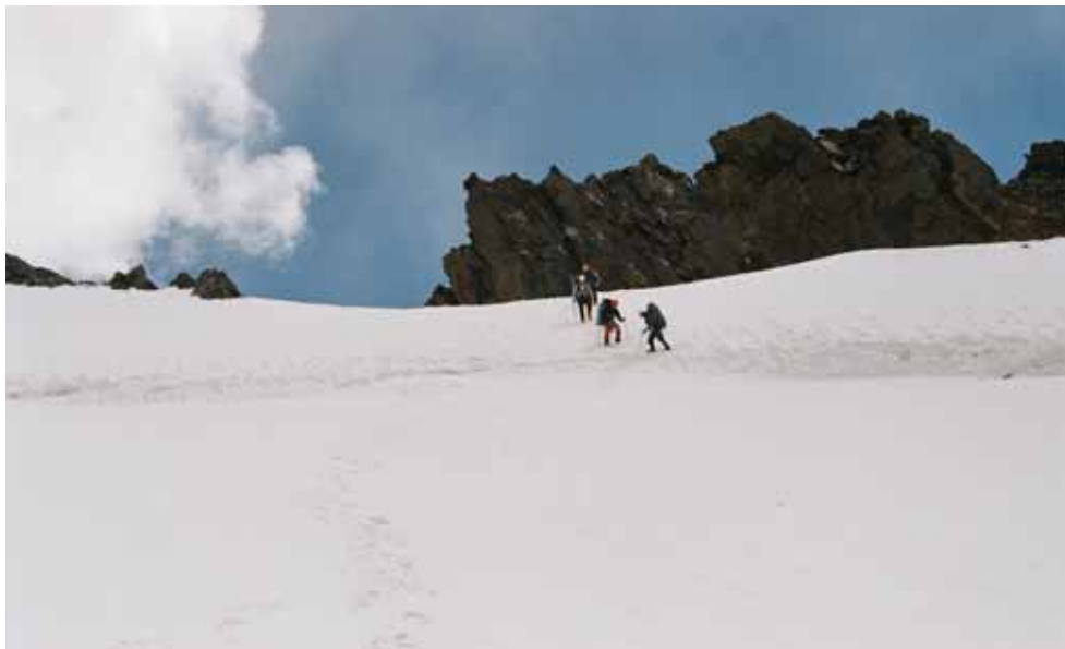
Фото № 111. Спуск с перевала Абалакова на предперевальное плато.