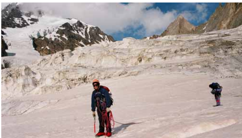
Фото № 117. Ступень ледника при выходе на основное тело ледника Рама.