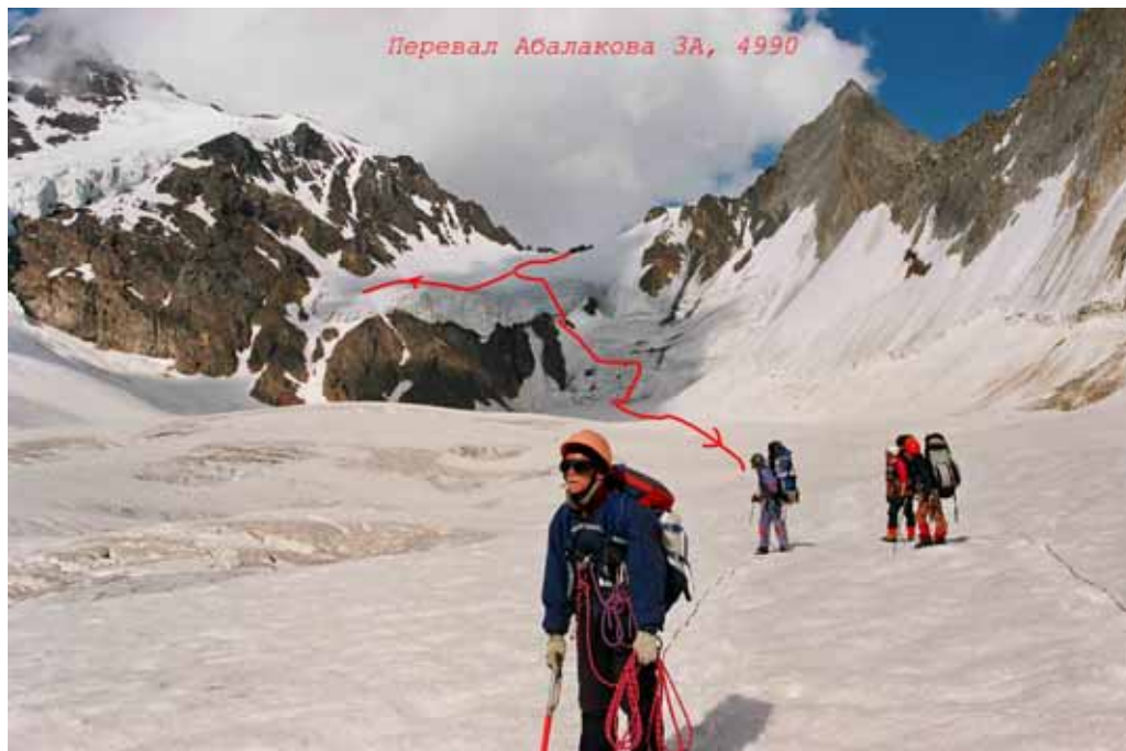
Фото № 116. Характер пути по ледниковой камере ледника Рама в цирке перевала Абалакова.