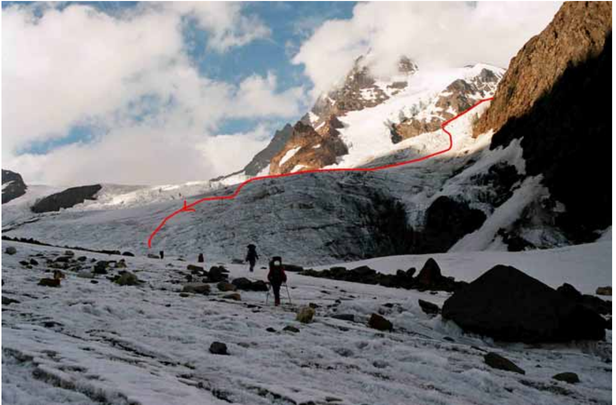
Фото № 119. Характер пути по леднику Рама.