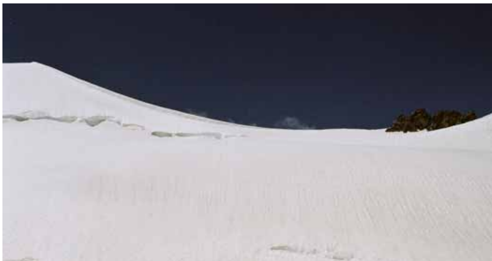
Фото № 108. Седловина перевала Абалакова с востока.