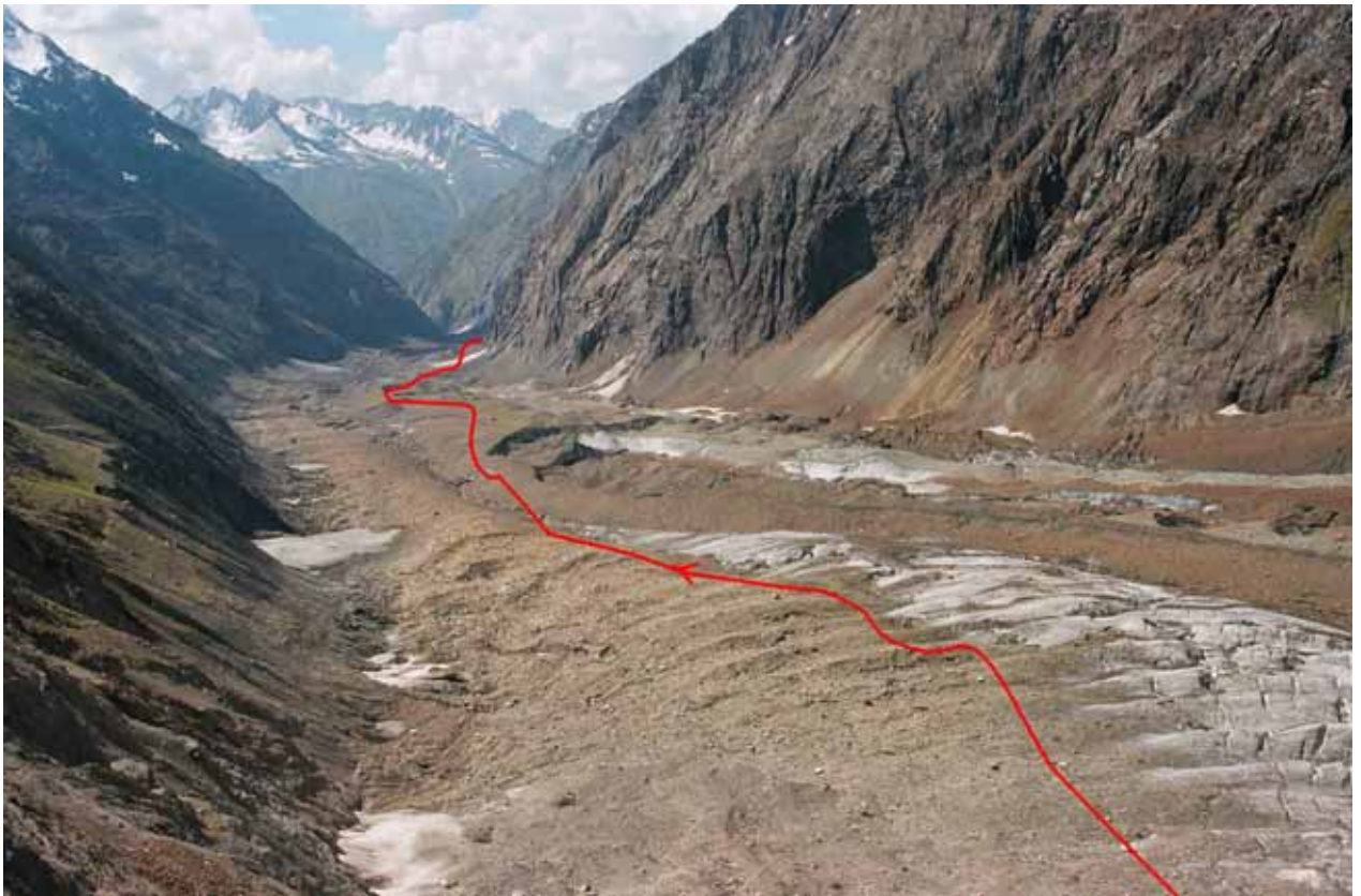
Фото № 125. Характер ледника Рама ниже ледопада.