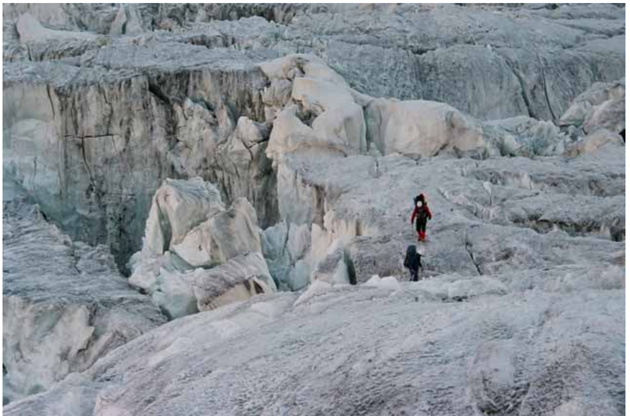
Фото № 120. Зона разломов перед началом нижнего ледопада Рама.