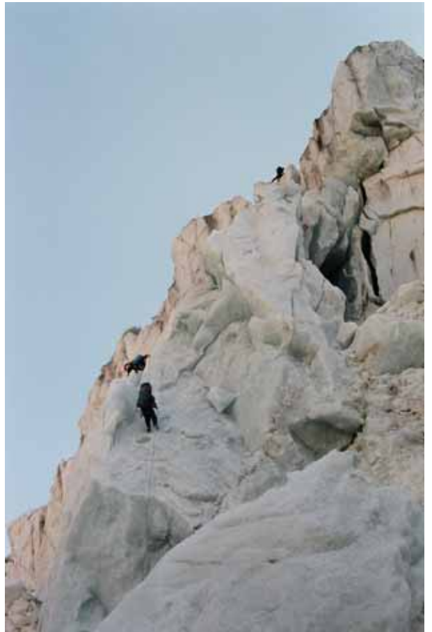
Фото № 121, 122. Спуск с верхней точки сброса в ледовый разлом (первая и вторая верёвки).