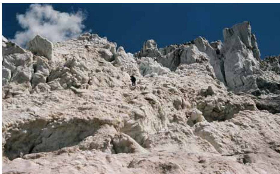
Фото № 129. Спуск по ледопаду Рама.