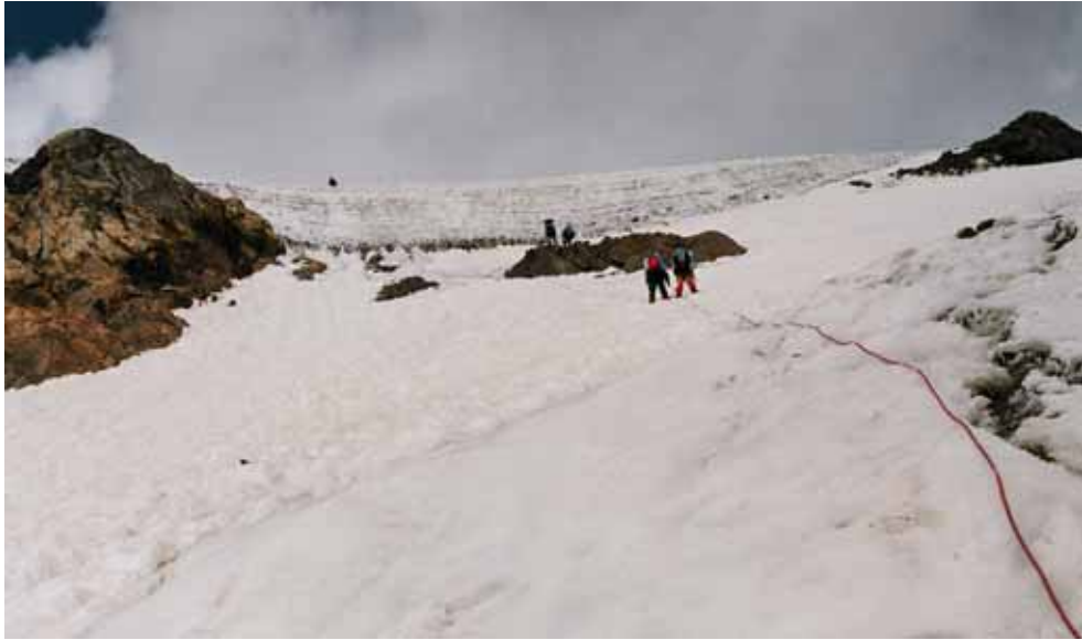
Фото № 113. Спуск с предперевального плато. Прохождение первой и второй верёвок.