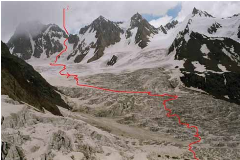
Фото № 104. Вид со скального пояса на путь через ледопад ледника Фарахноу. 1 – перевал Нансена (3А,4860).