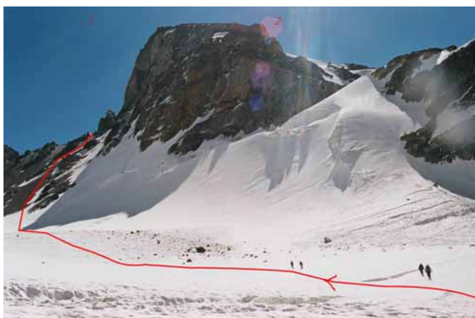
Фото № 60. В верховьях ледника Королёва. 1 – район перевала Хергиани; 2 – пик Памяти Хергиани.