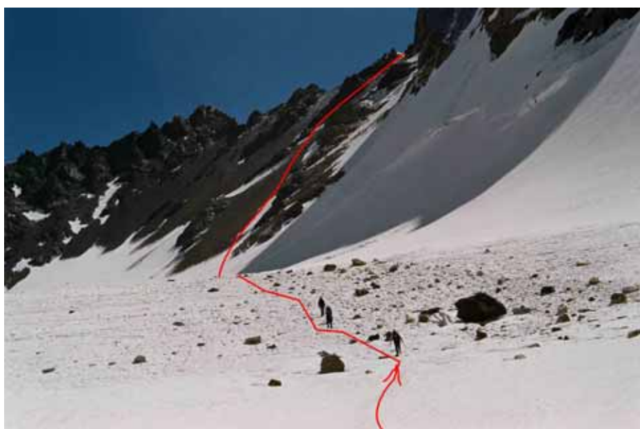
Фото № 61. Подход к перевальному взлёту перевала Хергиани.