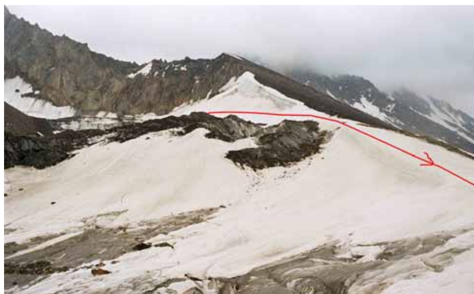
Фото № 54. Путь обхода ступени ледника по снежно-ледовому гребню.