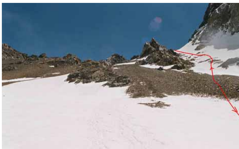
Фото № 65. Перевальный взлёт перевала Хергиани с ледника Королёва.