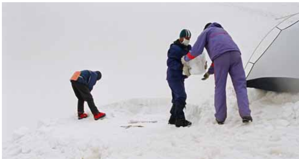
Фото № 43. Подготовка места бивака на снежном склоне под седловиной перевала Землепроходцев.