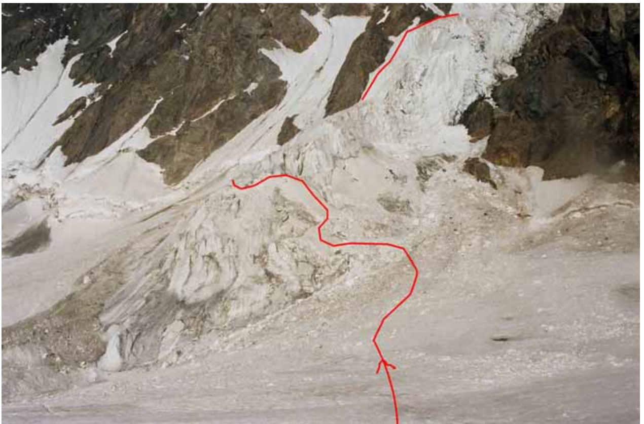
Фото № 56. Первая ступень ледопада ледника Нансена.