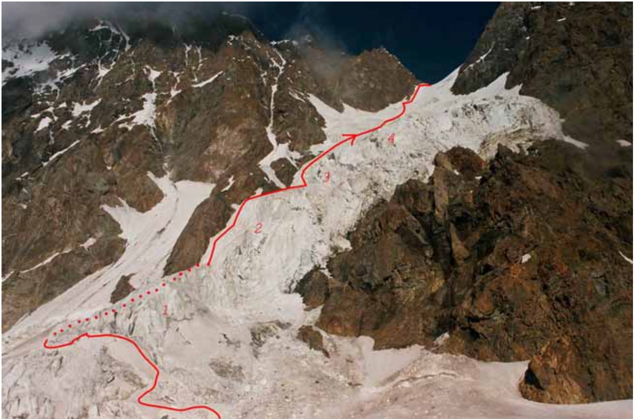
Фото № 57. Ледопад Нансена с ледника Толстова. 1 – первая ступень; 2 – вторая ступень; 3 – третья ступень; 4 – четвёртая ступень.