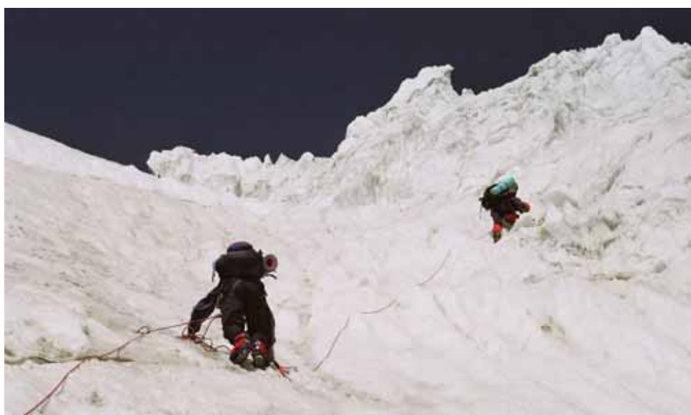
Фото № 39. Прохождение крутого снежно-ледового участка перед второй ступенью ледника.