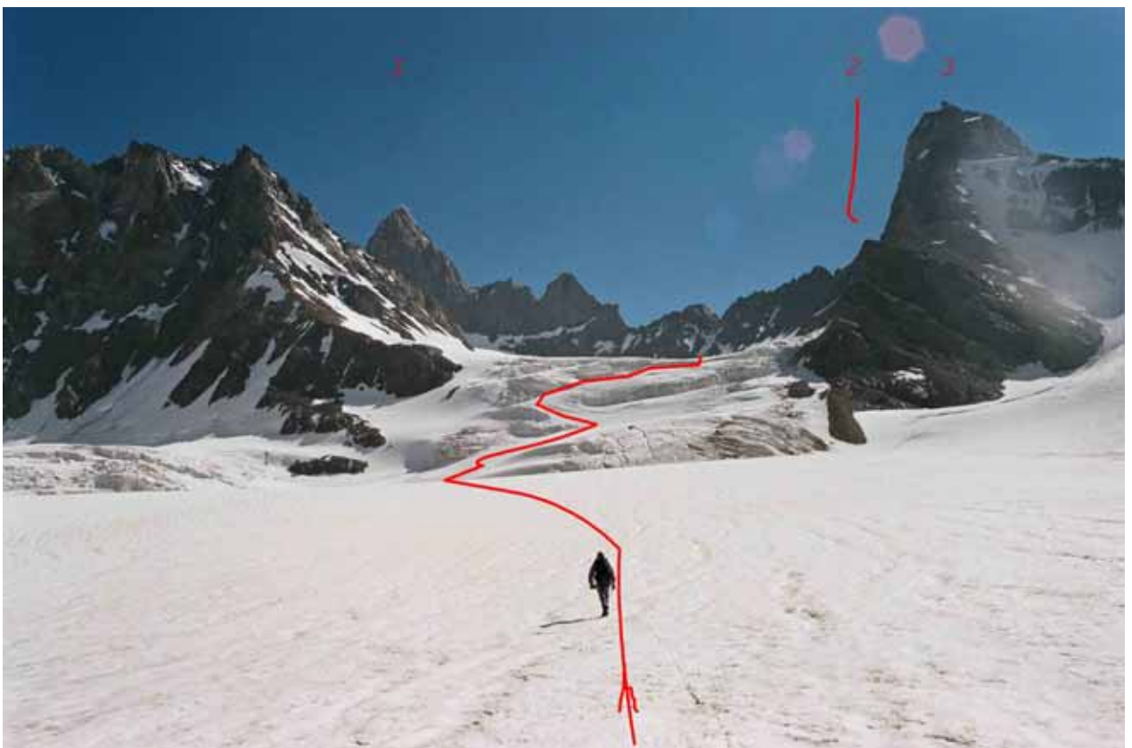
Фото № 58. Устьевая ступень ледника Королёва. 1 – пик Туркестан; 2 – район перевала Хергиани; 3 – пик Памяти Хергиани.