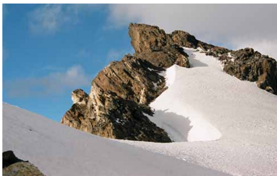
Фото № 45. Вершина пика Землепроходцев (5409) с запада. Снято во время разведки.