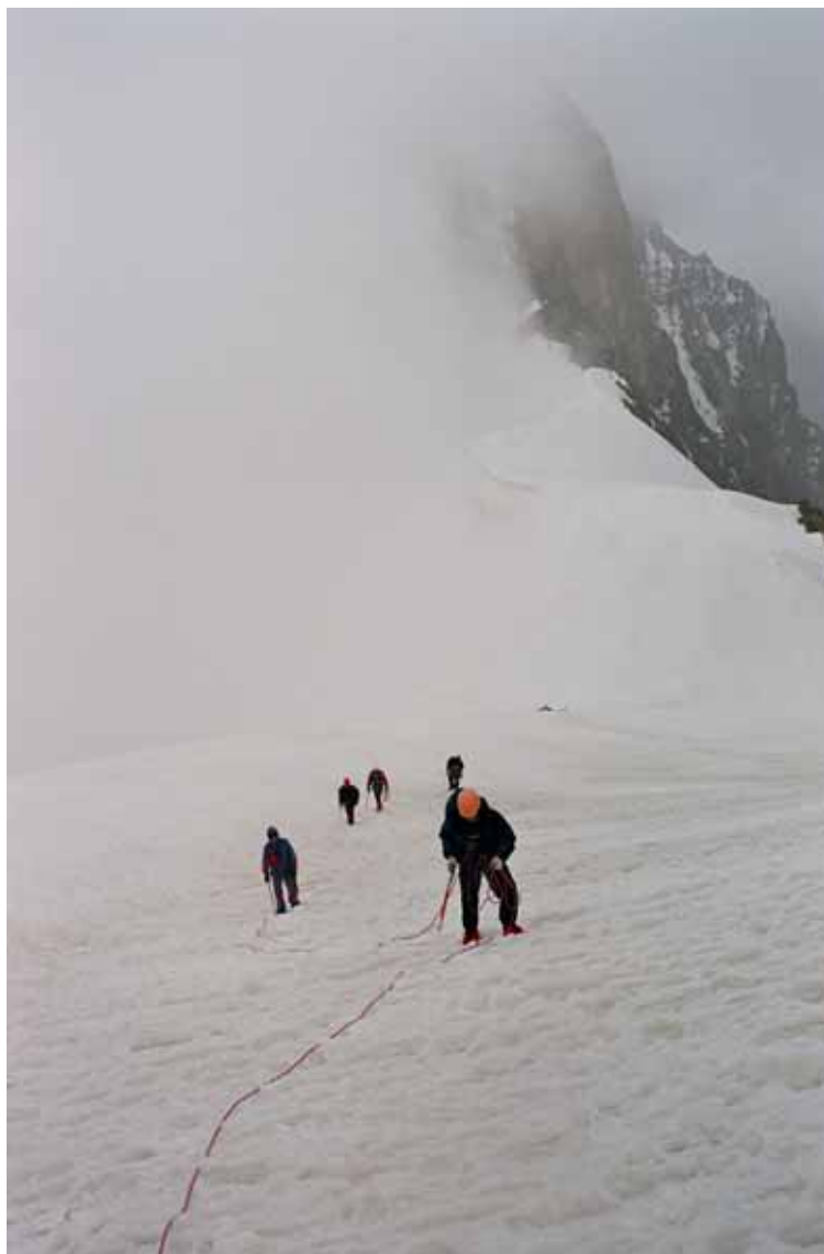
Фото № 47. Подъём по снежно-ледовому склону на вершину пика Землепроходец.