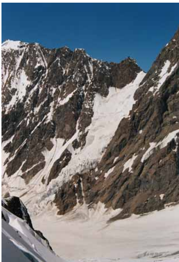
Фото № 62. Перевал Нансена с перевала Хергиани.