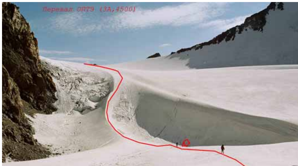
Фото № 37. Верховья ледника Скачкова и место ночёвки под перевалом Землепроходцев.