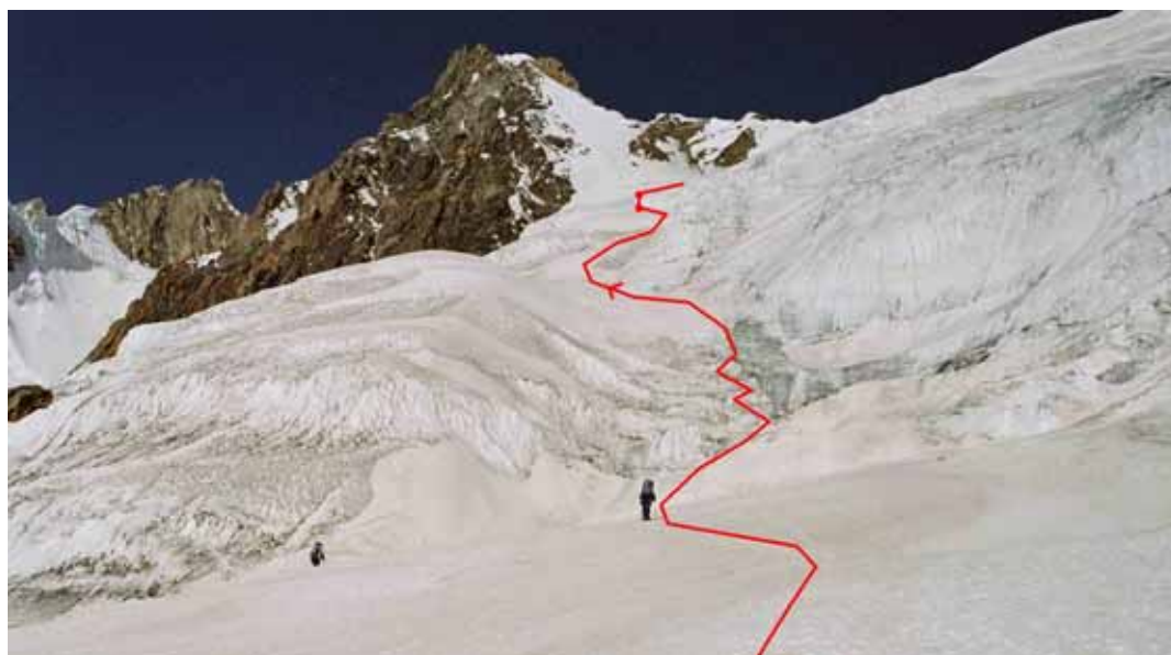
Фото № 38. Начало подъёма на перевал Землепроходцев.