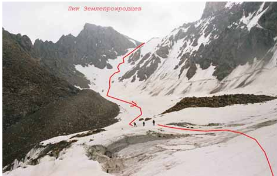
Фото № 52. Перевал Землепроходцев от ступени ледника.