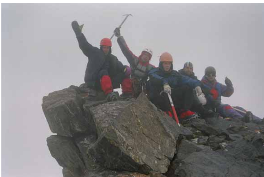
Фото № 48. Группа на вершине пика Землепроходец (2А,5409).