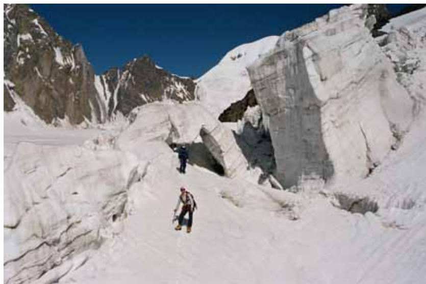
Фото № 59. Прохождение зоны разломов на устьевой ступени ледника Королёва.