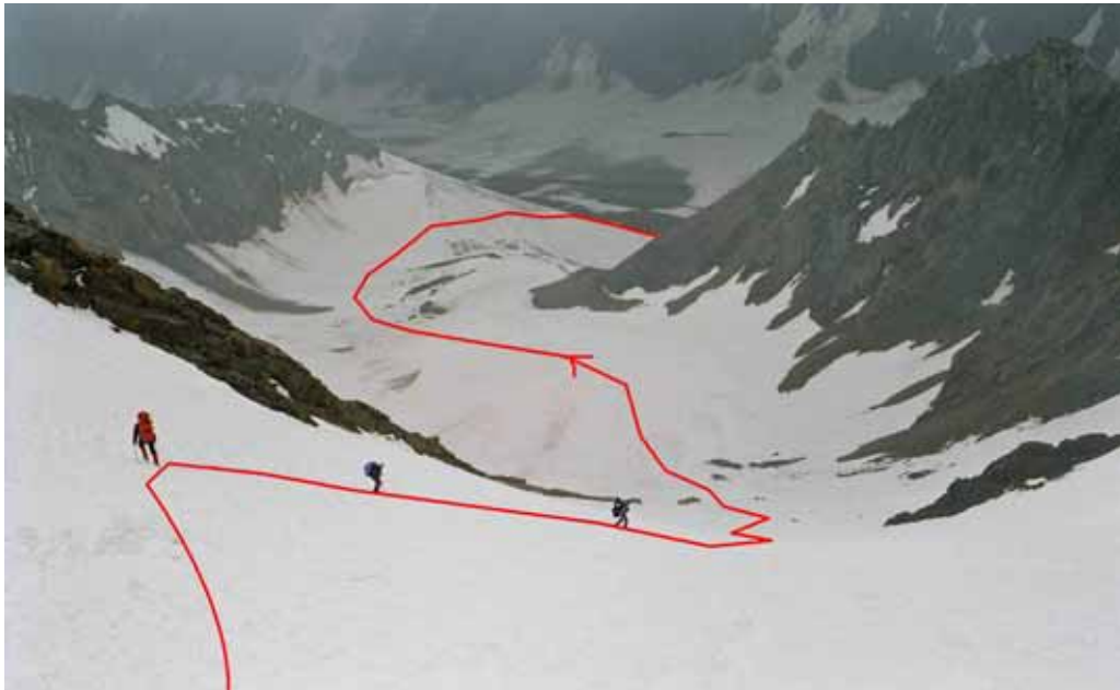
Фото № 49. Начало спуска с перевала Землепроходцев (2Б,5180).