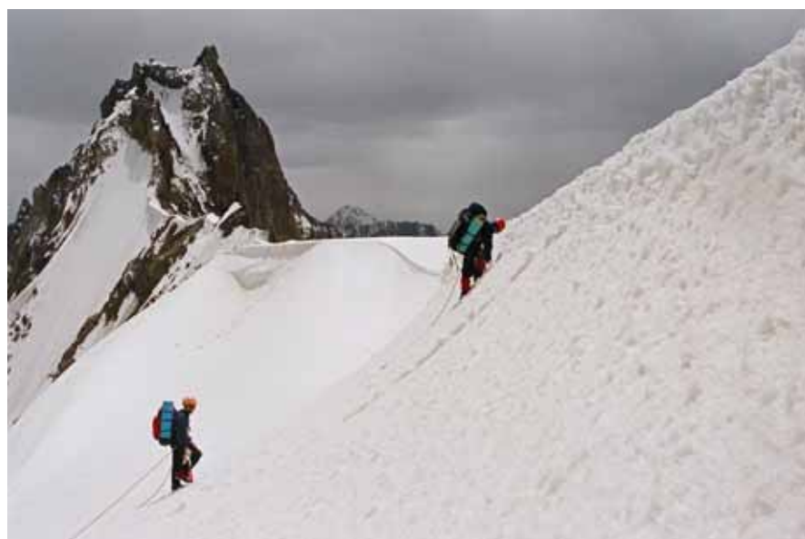
Фото № 42. Выход на седловину перевала Землепроходцев (2Б, 5180).