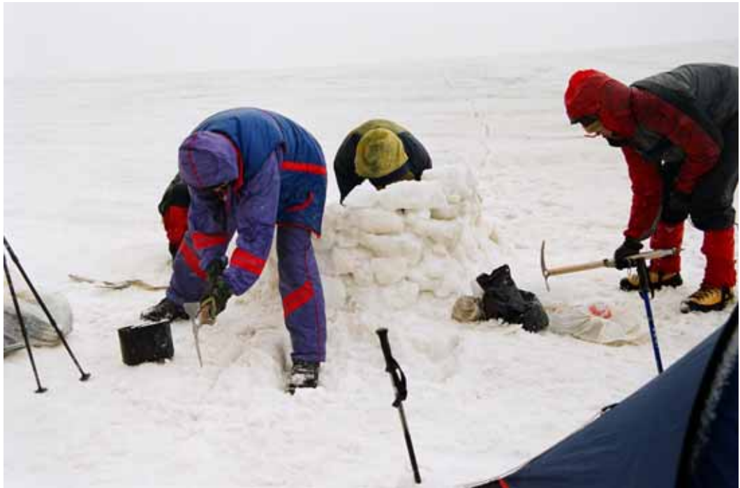
Фото № 55. Обустройство лагеря под перевалом Нансена на леднике Толстова.