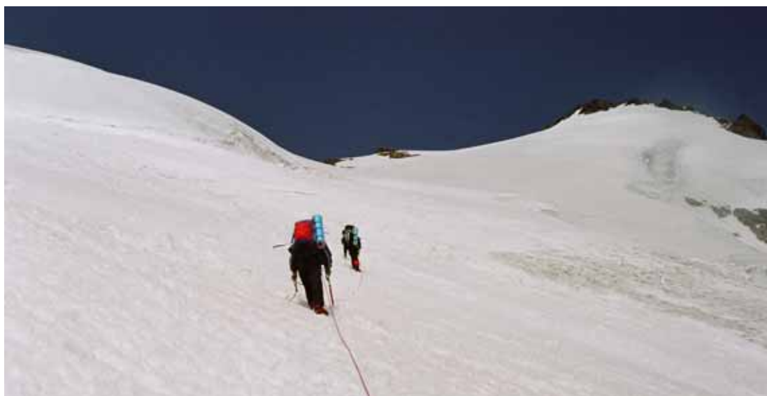
Фото № 41. Траверс снежно-ледового склона перед выходом на наклонное предперевальное плато.