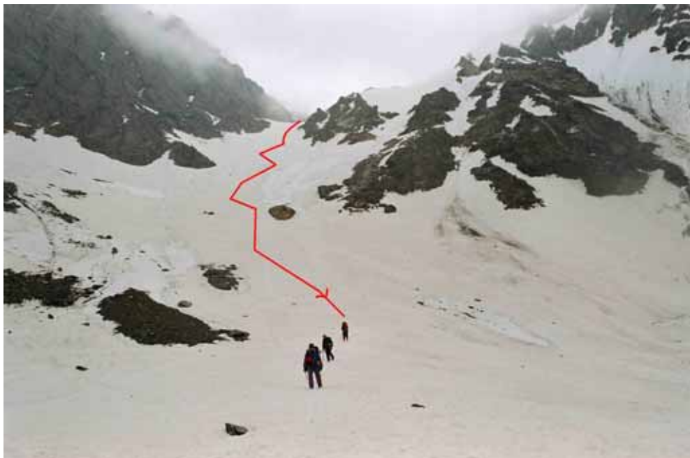
Фото № 50. Вид на перевал Землепроходцев (2Б, 5180) с запада.