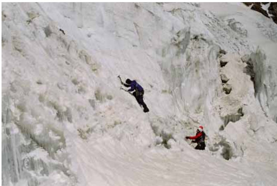
Фото № 40. Преодоление ледового участка второй ступени.