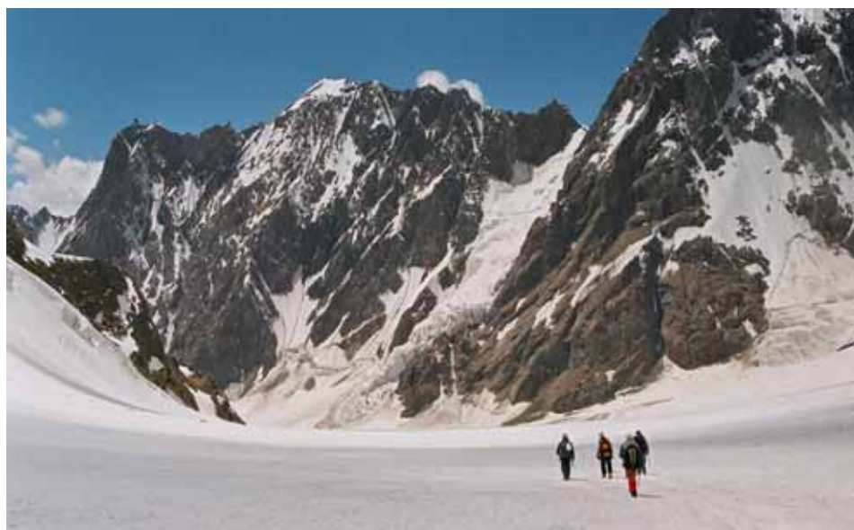
Фото № 66. Возвращение в лагерь под перевалом Нансена.