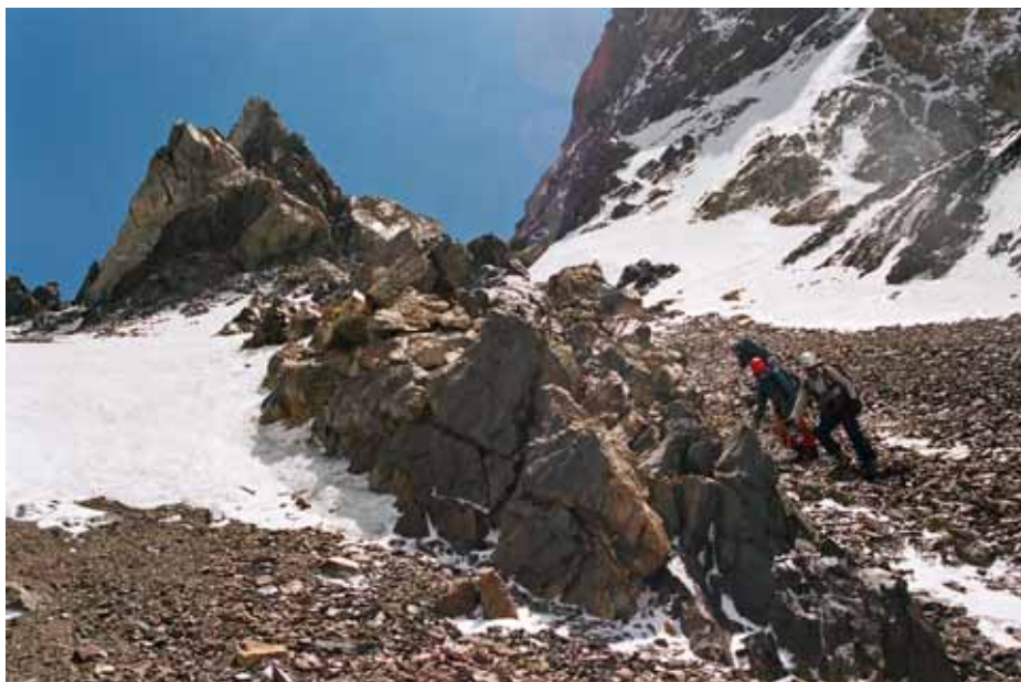
Фото № 64. Спуск с перевала Хергиани на ледник Королёва.