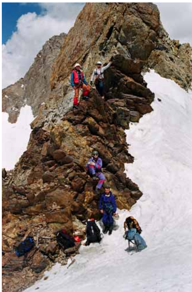
Фото № 63. Группа на перевале Михаила Хергиани (2Б,4740).