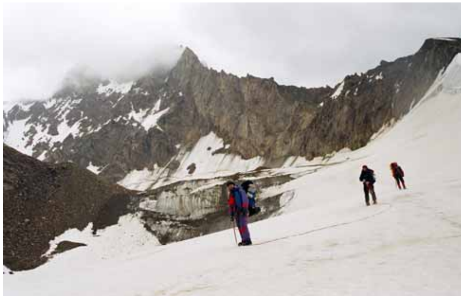
Фото № 53. Ступень ледника Землепроходцев.