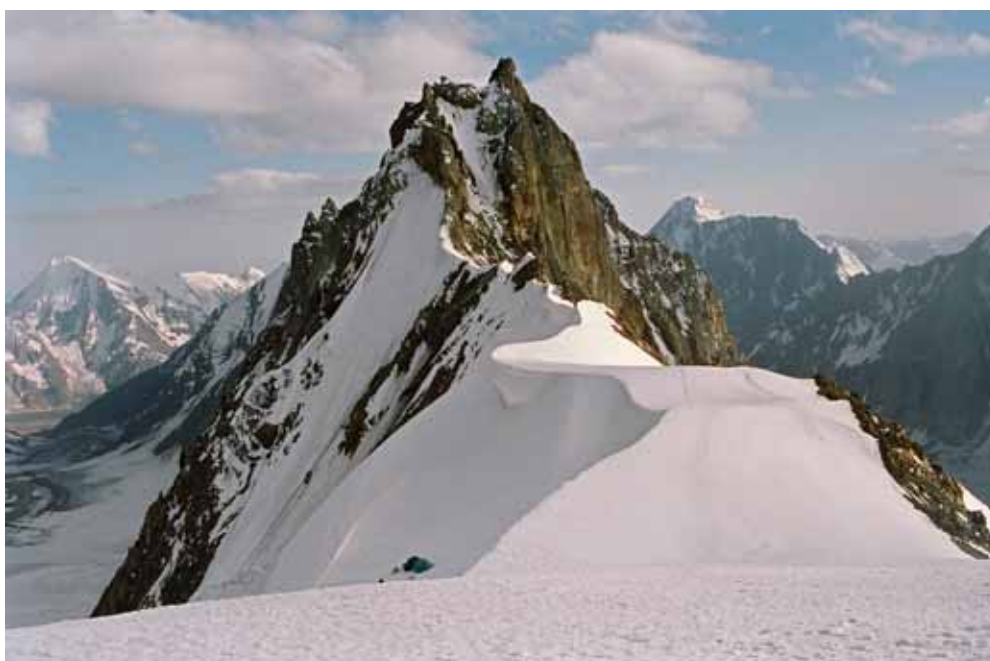
Фото № 44. Седловина перевала Землепроходцев и место ночёвки группы.