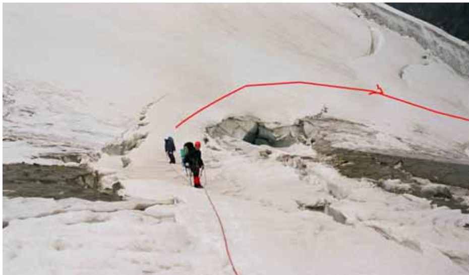
Фото № 51. Зона разрывов перед ступенью ледника Землепроходцев.