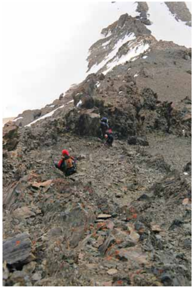
Фото № 23, 24. Характер пути по скальному контрфорсу перевала Хергиани.