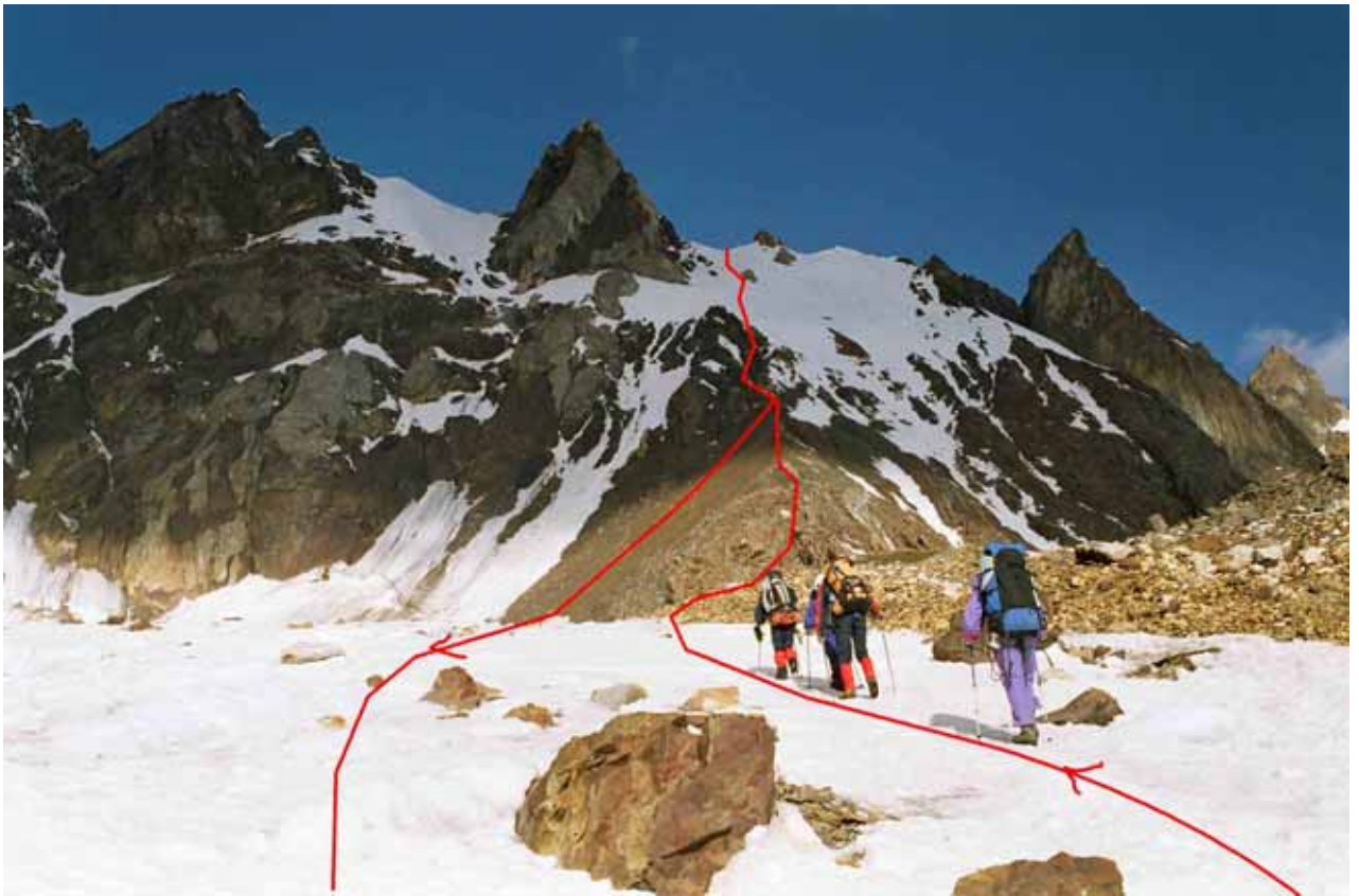
Фото № 22. Подход к основанию скального контрфорса перевала Хергиани.