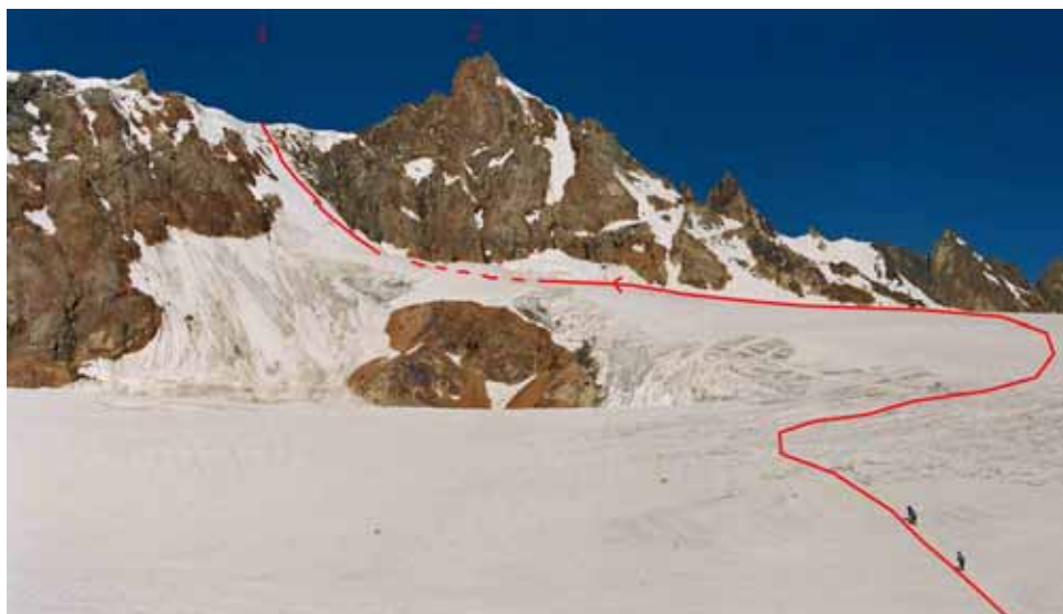
Фото № 28. Перевал ОПТЭ с ледника Щуровского. 1 – перевал ОПТЭ, 2 – пик Южный.