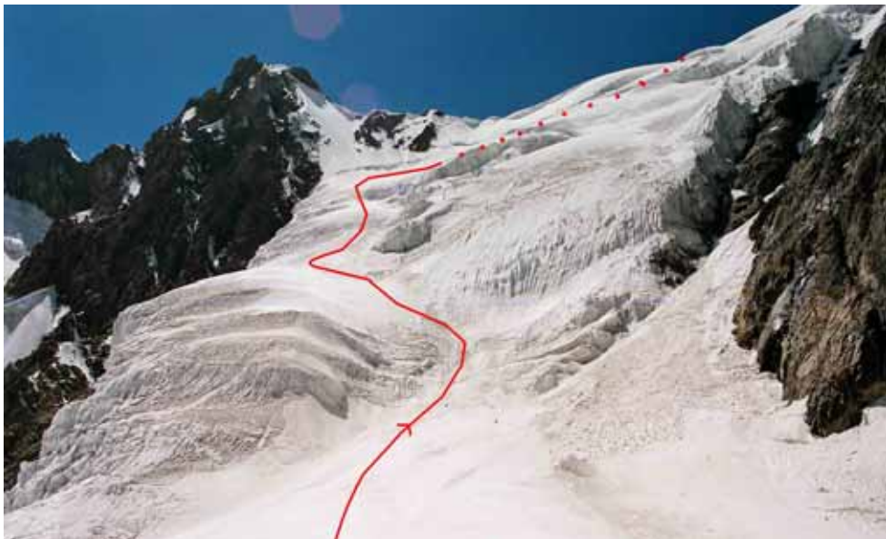
Фото № 36. Перевал Землепроходцев (2Б,5180) с ледника Скачкова.