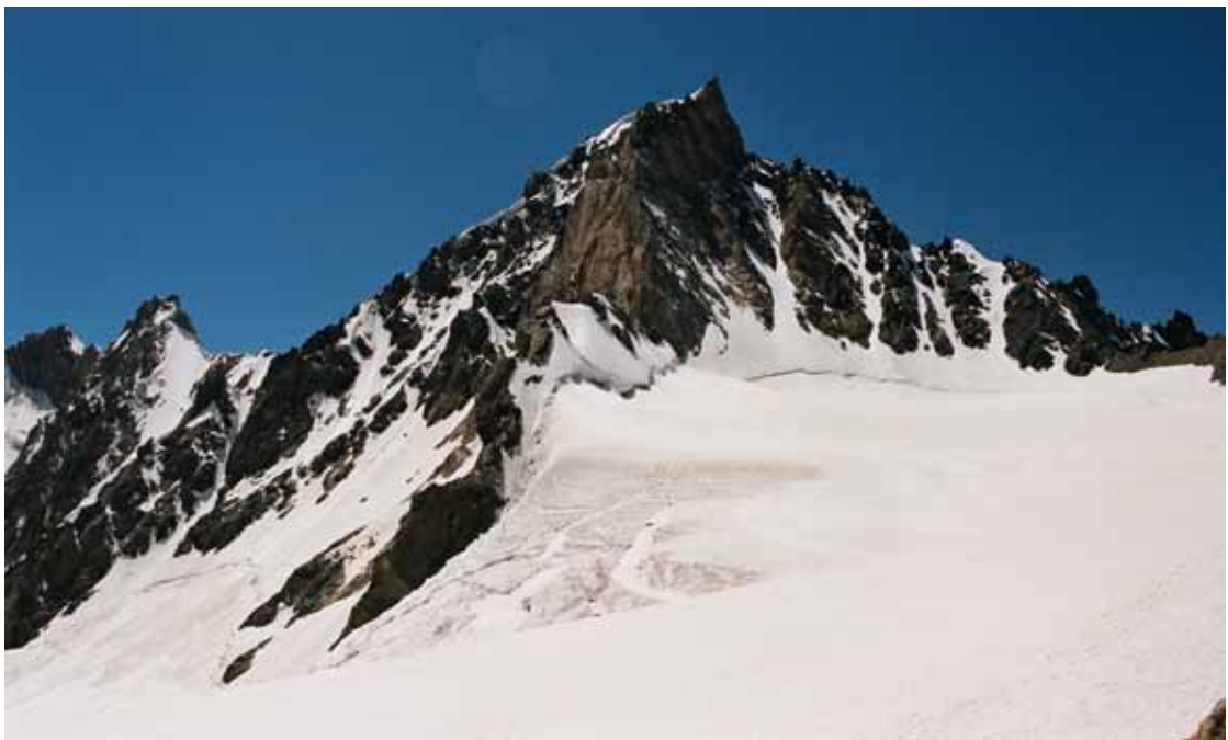
Фото № 33. Пик Землепроходцев (5 409) с перевала ОПТЭ.