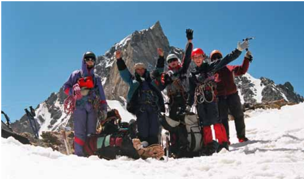
Фото № 34. Группа на перевале ОПТЭ (3А,4500).