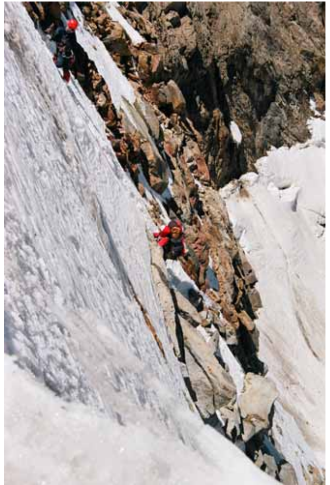
Фото № 30. Подъём через бергшрунд на перевале ОПТЭ. Фото № 32. Третья верёвка при подъёме на перевал ОПТЭ.