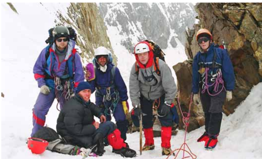
Фото № 27. Группа на перевале Михаила Хергиани (2Б,4740).