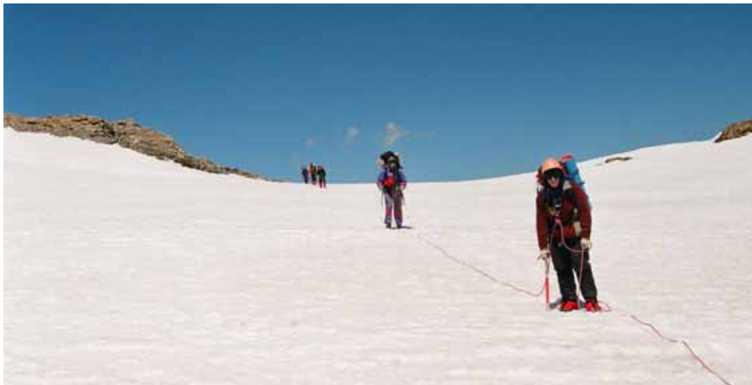
Фото № 35. Спуск с перевала ОПТЭ в верховья ледника Скачкова.