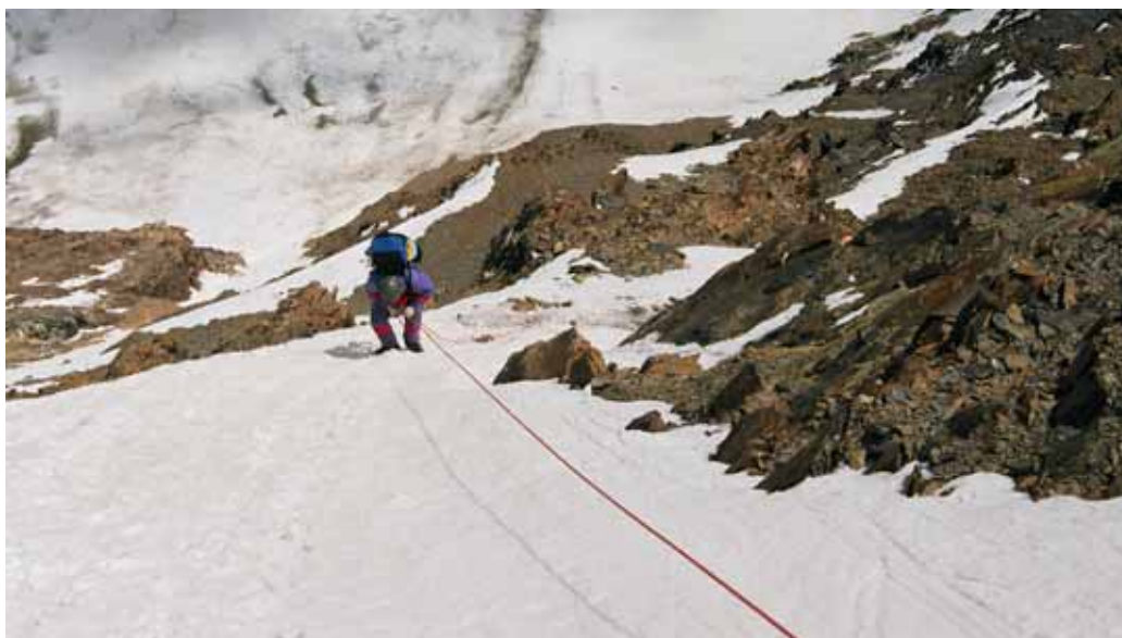
Фото № 25. Подъем по снежно-ледовому склону от верхней части скального контрфорса.