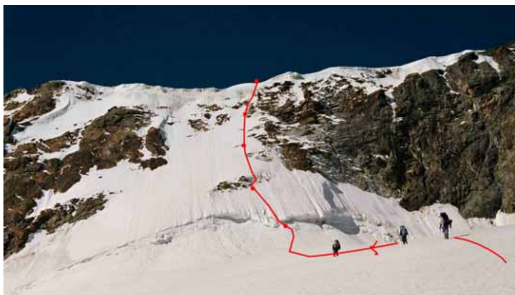
Фото № 29. Седловина перевала ОПТЭ (3А,4500) с севера.