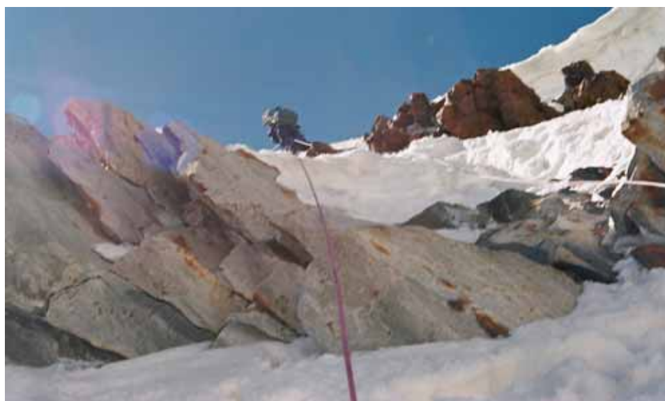
Фото № 31. Вторая веревка при подъёме на перевал ОПТЭ.