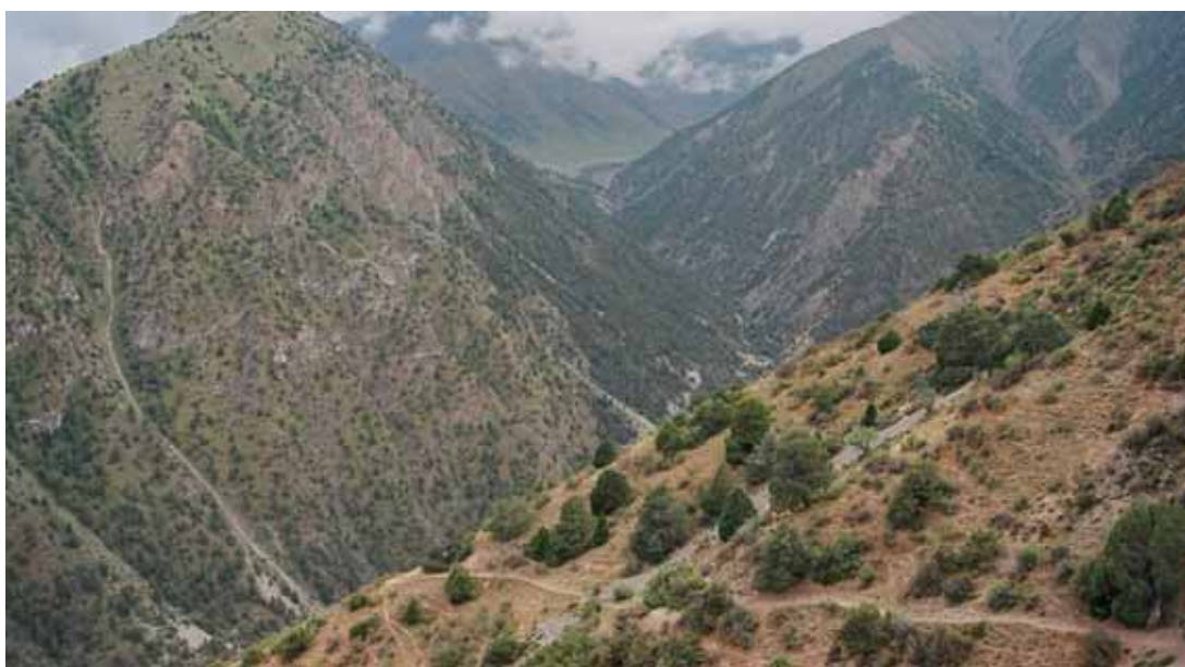
Фото № 3. Тропа с перевала Дунон, ведущая в долину реки Бирксу.