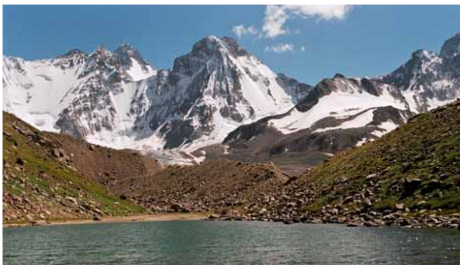
Фото № 17. Вид на Туркестанский хребет от озера.