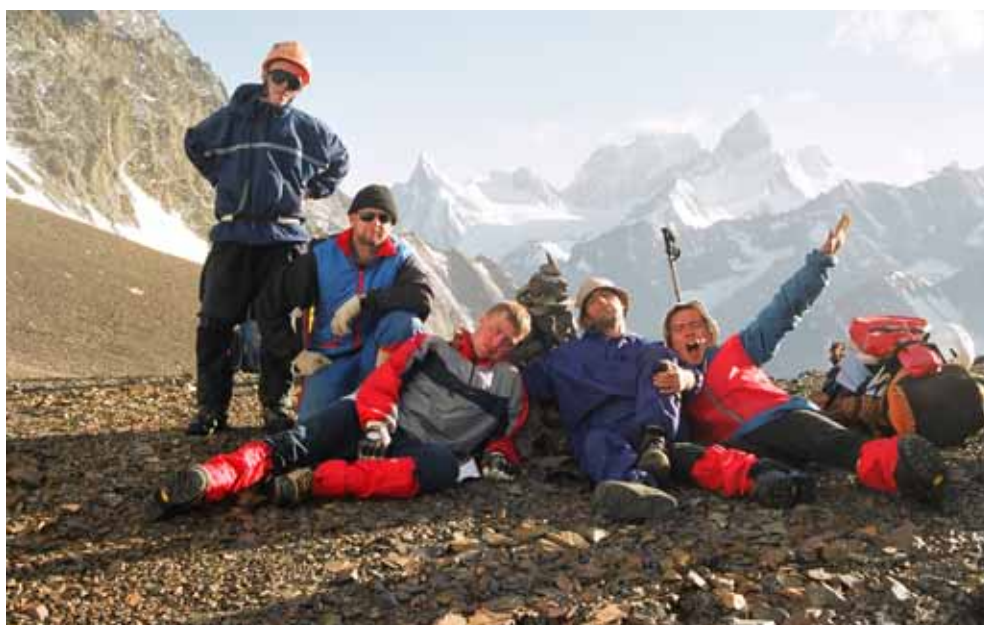
Фото № 11. Группа на перевале Бирксу (1Б, 4240).