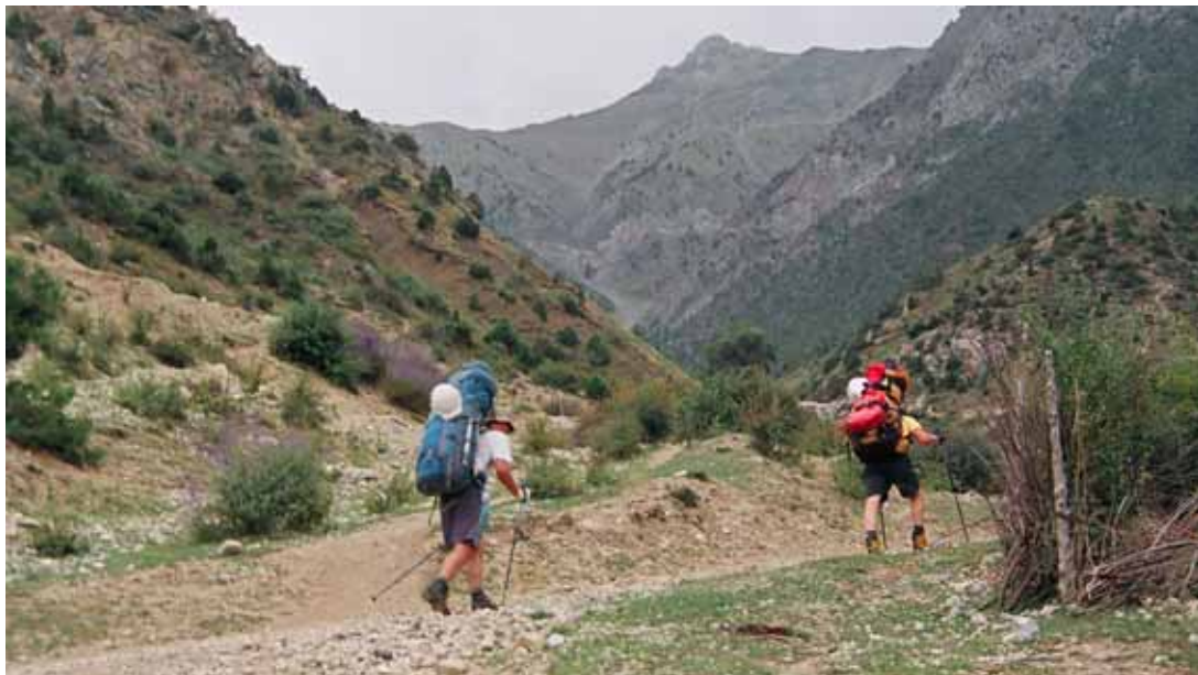
Фото № 1. Начало дороги от реки Чегеслы к перевалу Дунон.