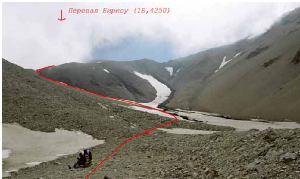
Фото № 10. Перевал Бирксу (1Б, 4240) с востока.