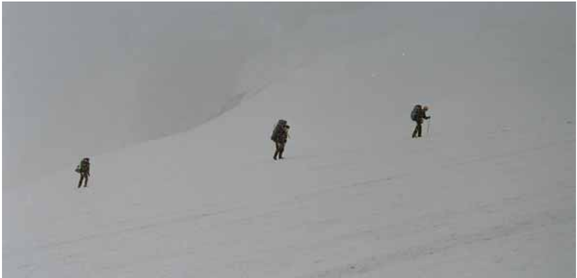
Фото № 19. Путь через Ригель ОПТЭ в условиях непогоды.