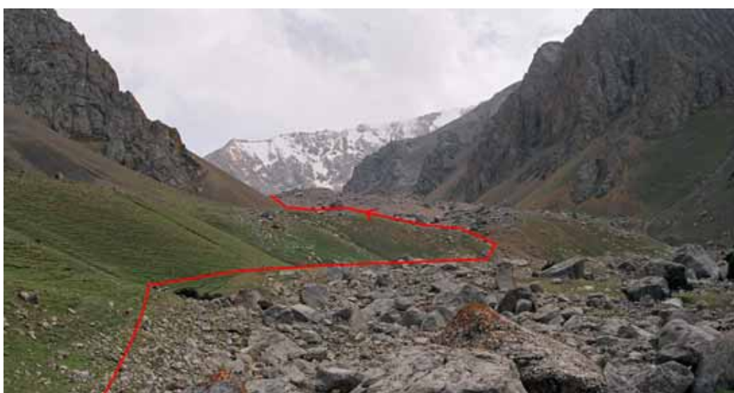
Фото № 6. Конечные морены ледника Бирксу.