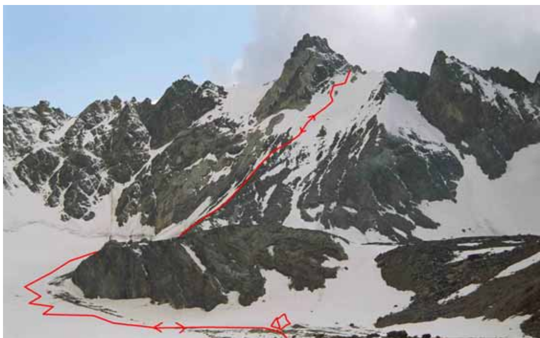
Фото № 21. Перевал Михаила Хергиани (2Б,4740) с Ригеля ОПТЭ.