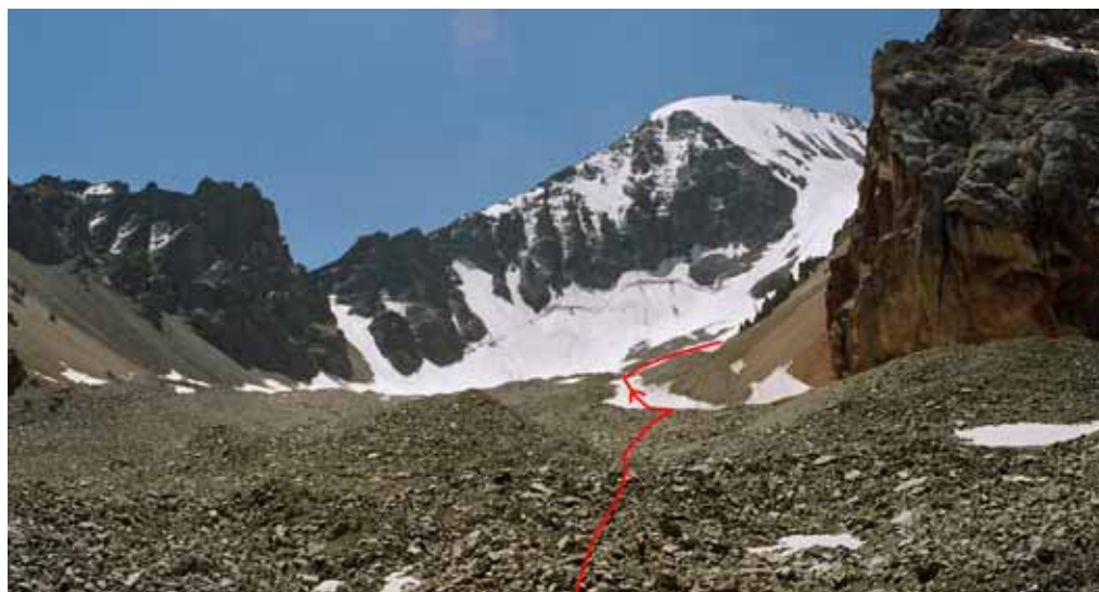
Фото № 8. Вершина-ориентир при подходе к цирку перевала Бирксу.