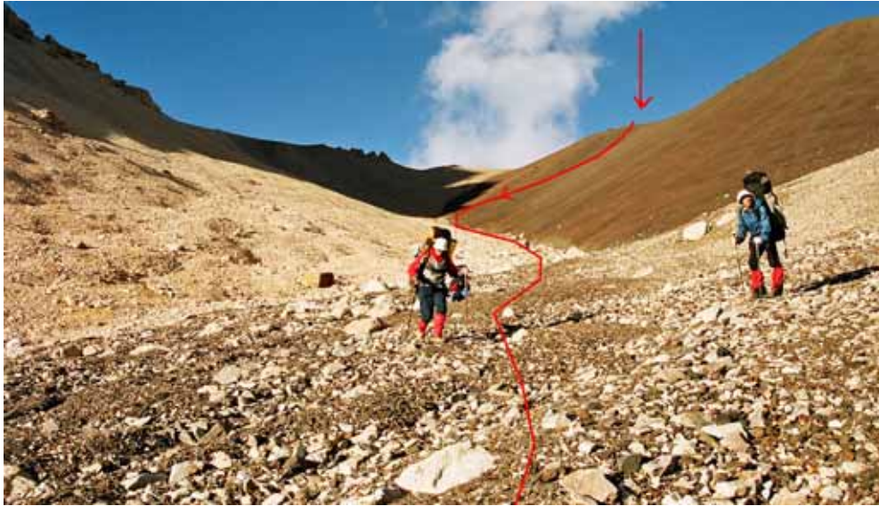
Фото № 13. Спуск с перевала Бирксу на запад.