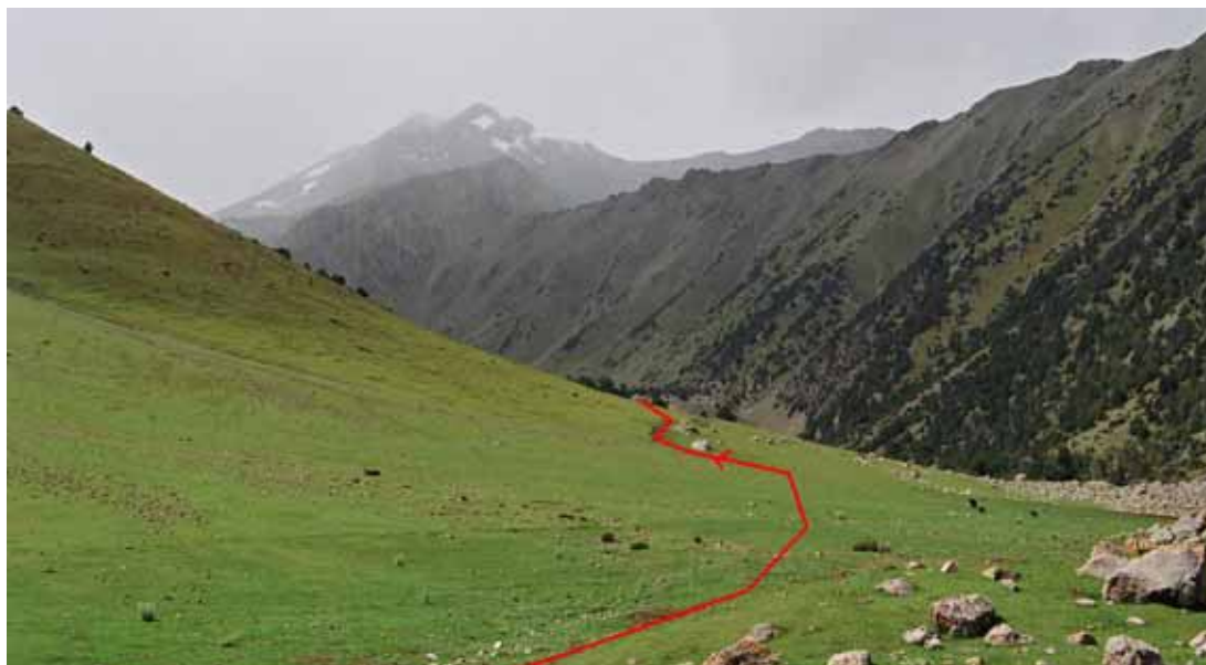
Фото № 4. Большая травянистая терраса после подъёма на каменный завал.