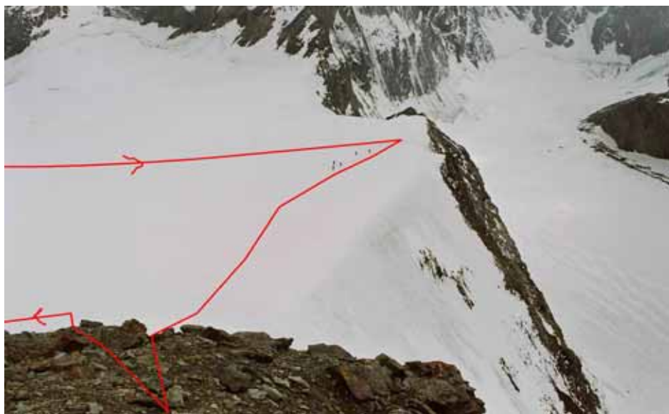
Фото № 20. На перевале Ригель ОПТЭ (2А, 4220). Вид с высшей точки на юг.