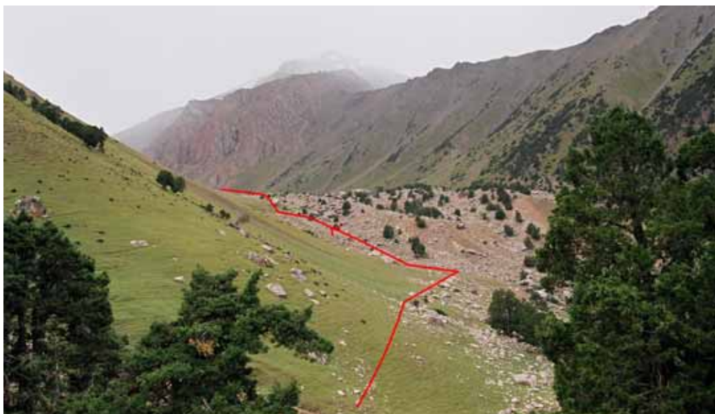
Фото № 5. Старый моренный вал, из-под которого начинается река Бирксу.