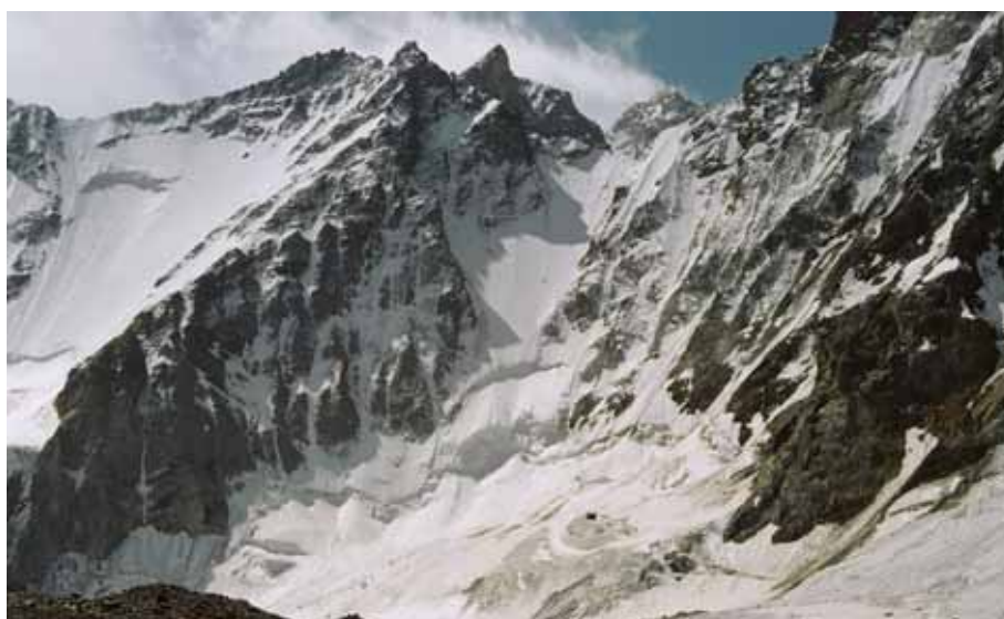
Фото № 18. Перевал Скачкова (3А,4670) с ледника Щуровского.