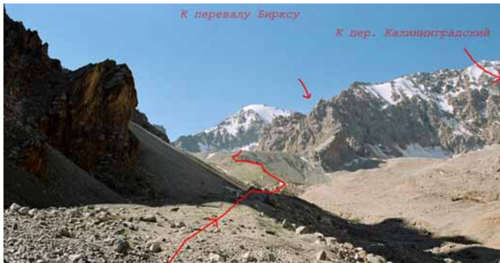
Фото № 7. Место выхода на правобережную морену ледника Бирксу. Видна развилка ущелья к перевалам Бирксу и Калининградский.