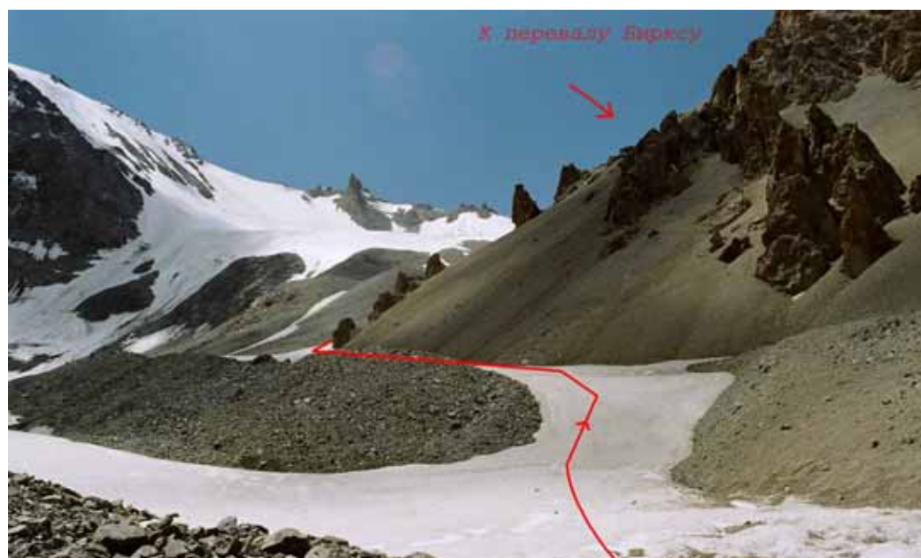
Фото № 9. Цирк перевала Бирксу с востока.