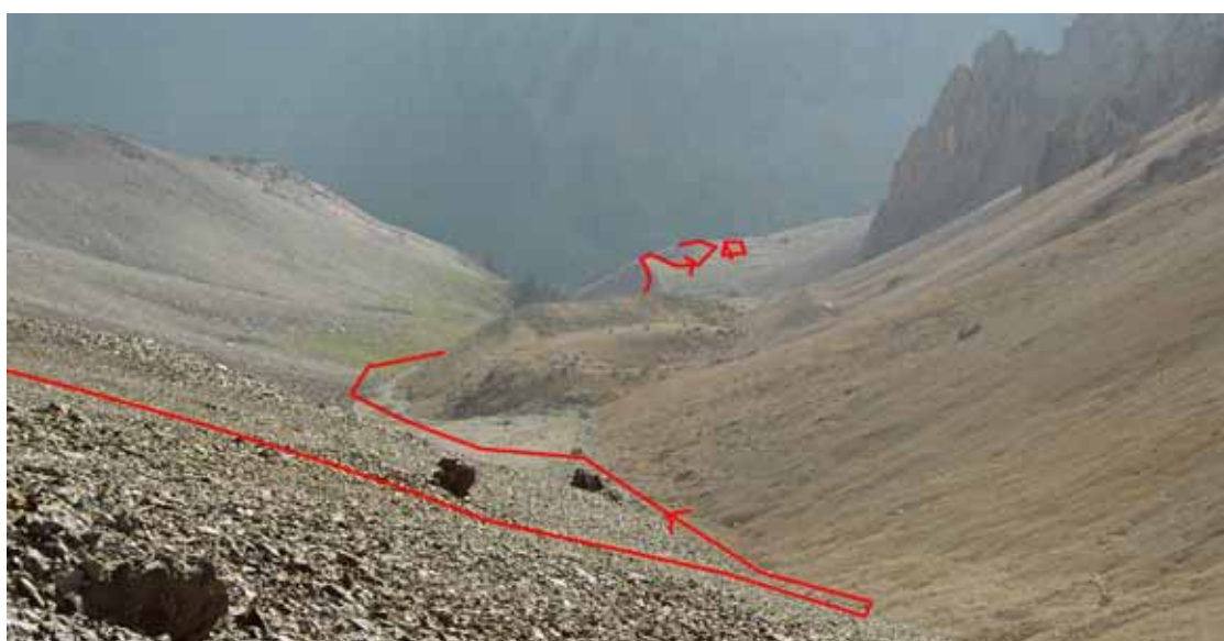
Фото № 12. Вид с перевал Бирксу за запад.