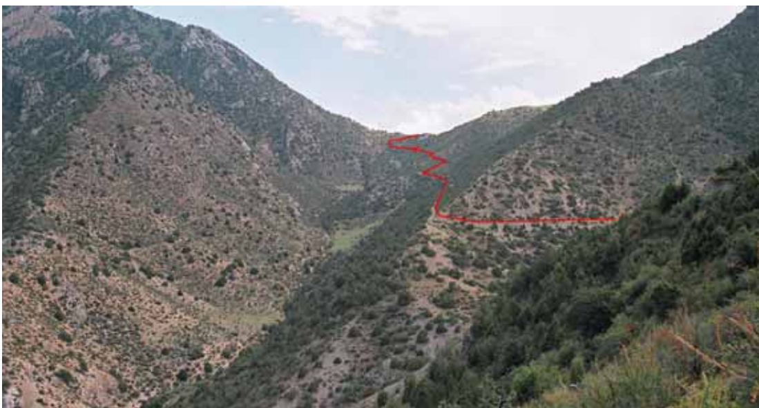
Фото № 2. Лощина, ведущая к перевалу Дунон с запада.