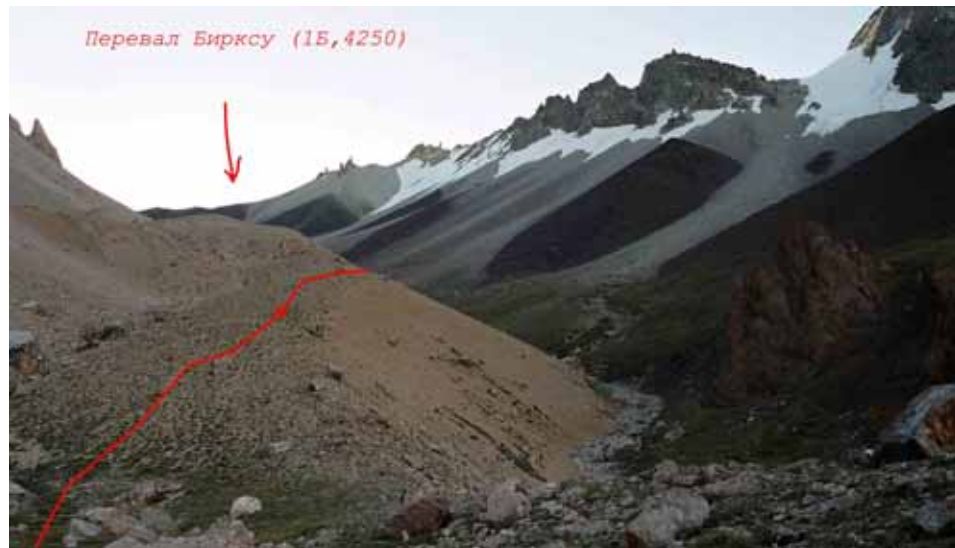
Фото № 14. Створ в сухой лощине при спуске с перевала Бирксу.